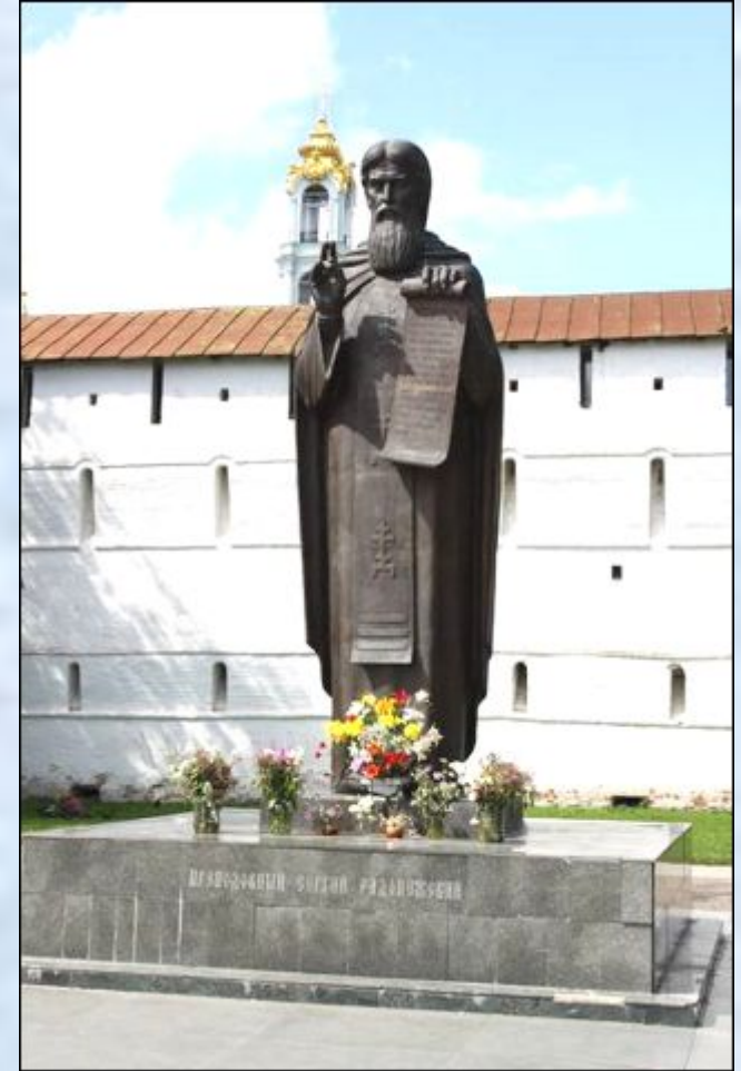
Памятник Сергию Радонежскому в Сергиевом Посаде