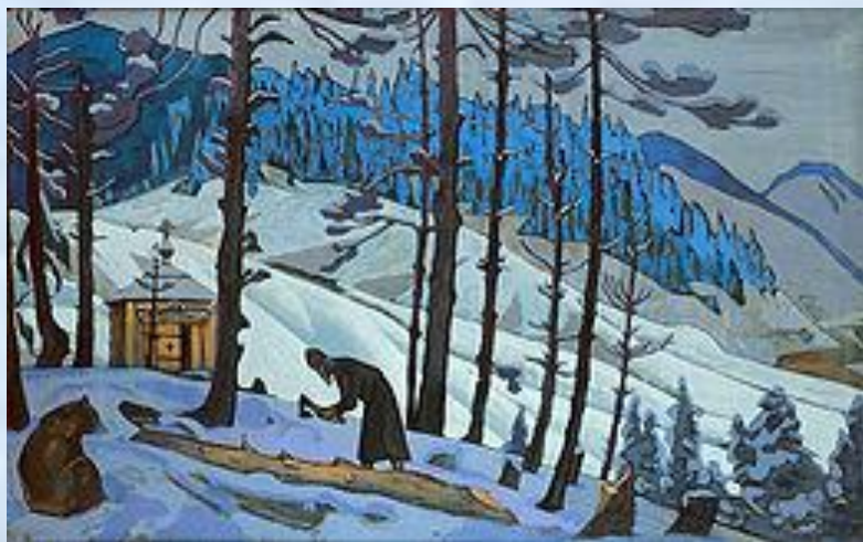
“Сергий Строитель” Николай Рерих

Сергий Радонежский стал основателем Свято-Троицкой Сергиевой лавры (монастыря).