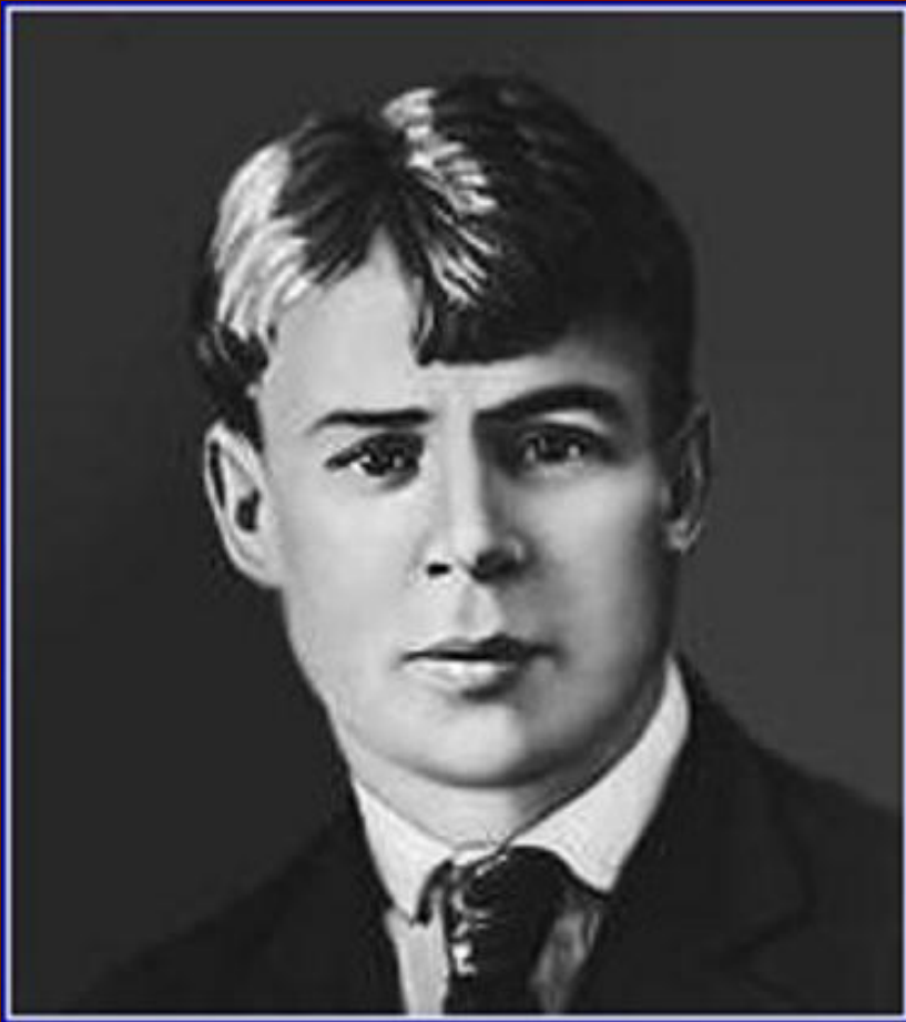
Есенин Сергей Александрович