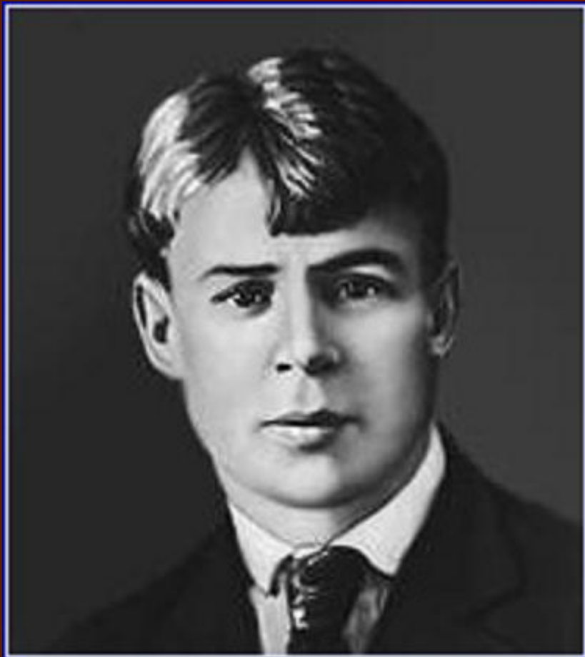
Есенин Сергей Александрович