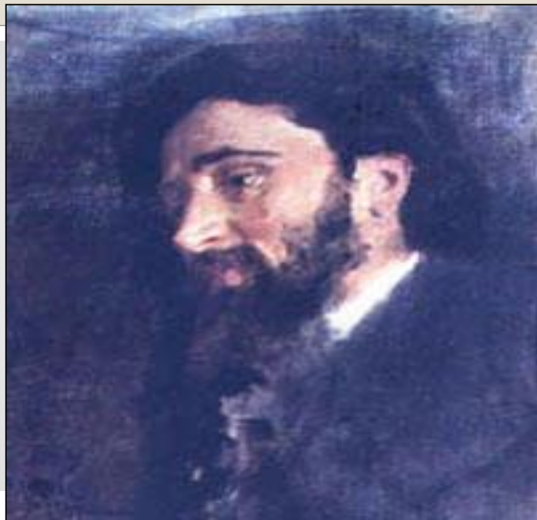
Всеволод Михайлович Гаршин