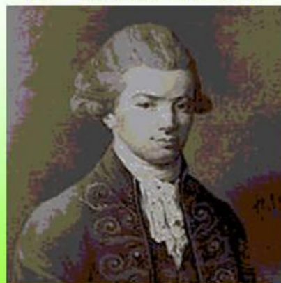
И. И. Хемницер