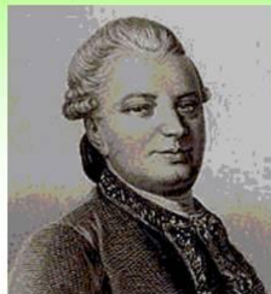
В. И. Майков