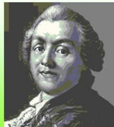
А. П. Сумароков