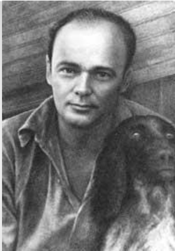
Чарушин Евгений Иванович