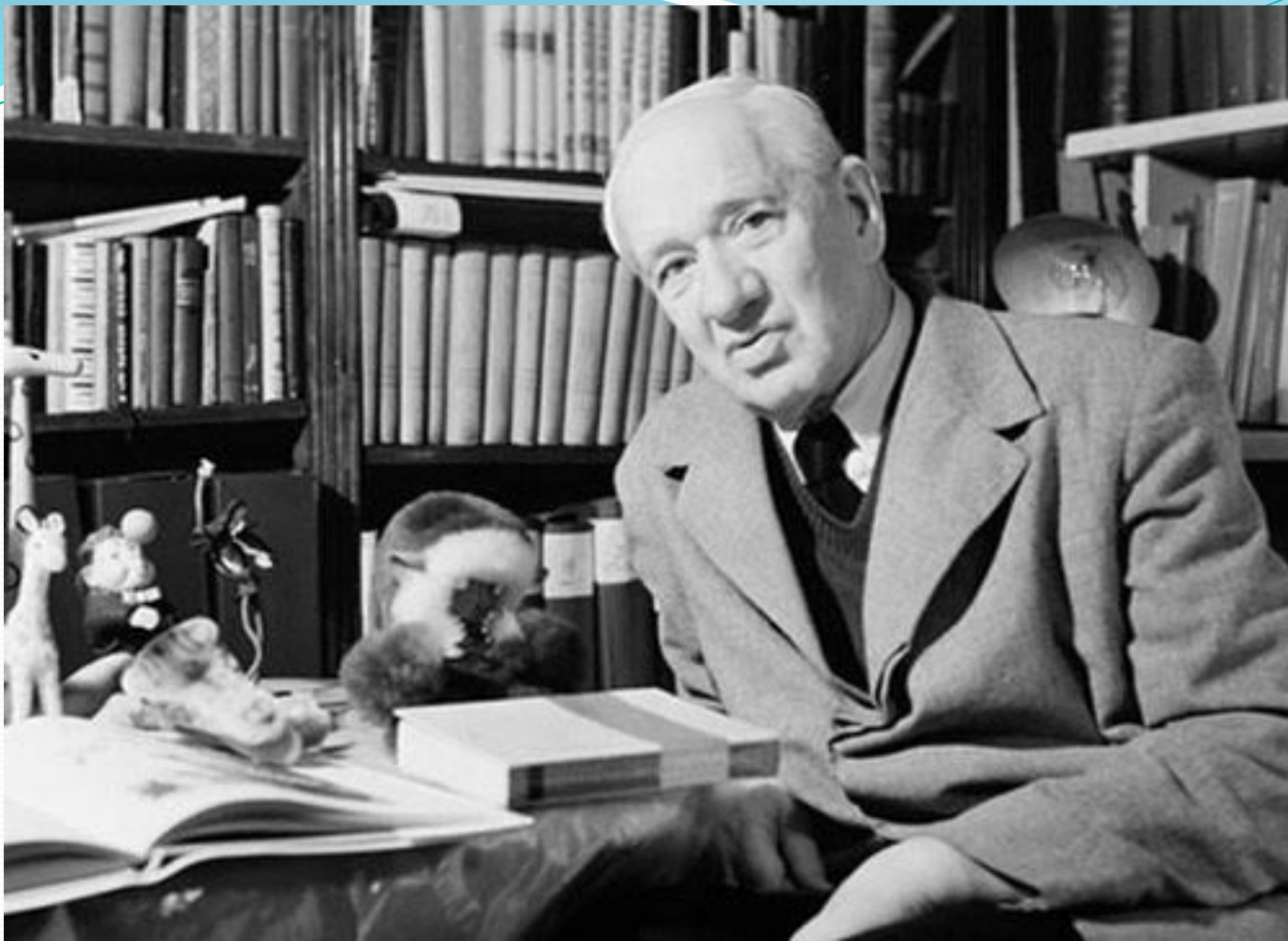
КОРНЕЙ ИВАНОВИЧ ЧУКОВСКИЙ