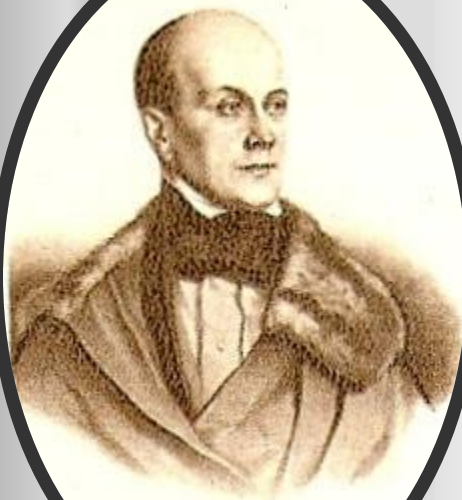
П. Я. Чаадаев

Лицом, на которое указывали как на прототип Чацкого , был П. Я. Чаадаев , был П. Я. Чаадаев. Пушкин , был П. Я. Чаадаев. Пушкин писал П. А. Вяземскому , был П. Я. Чаадаев. Пушкин писал П. А. Вяземскому: «Что такое Грибоедов? Мне сказывали, что он написал комедию на Чедаева; в теперешних обстоятельствах это чрезвычайно благородно с его стороны» . Но сближение Чацкого с Чаадаевым сохранилось в устной, потом в печатной традиции.