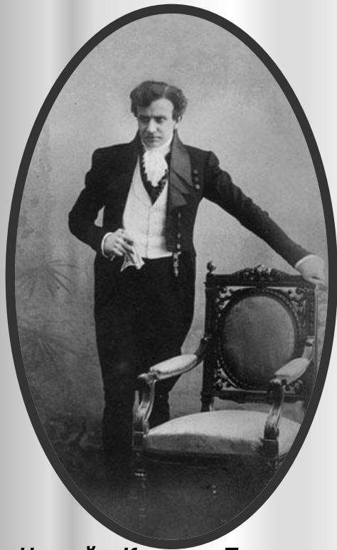
Чацкий – Качалов. Постановка МХАТ