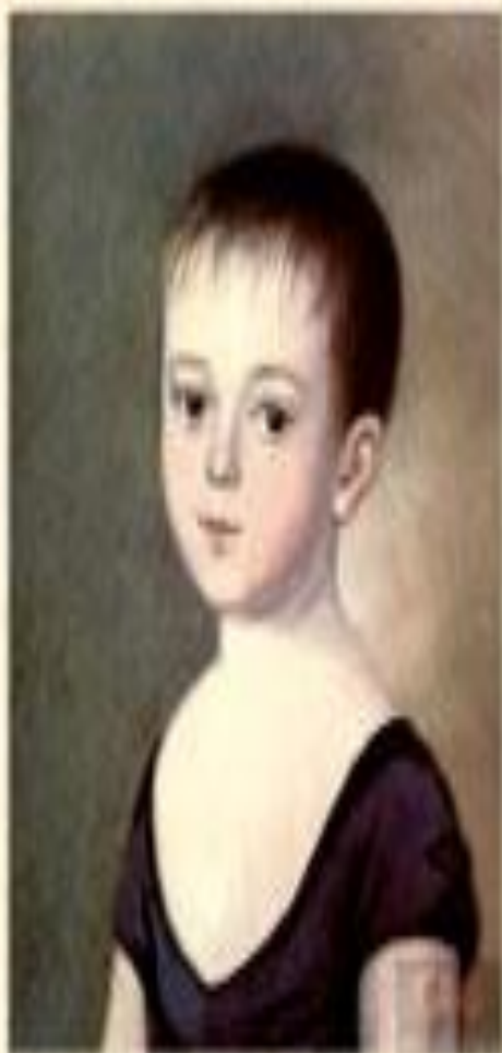
Ф.И. Тютчев в детстве Копия с портрета К. Барду. 1808-1830

Федор Иванович Тютчев родился 23 ноября (5 декабря) 1803 года в селе Овстуг Орловской губернии.