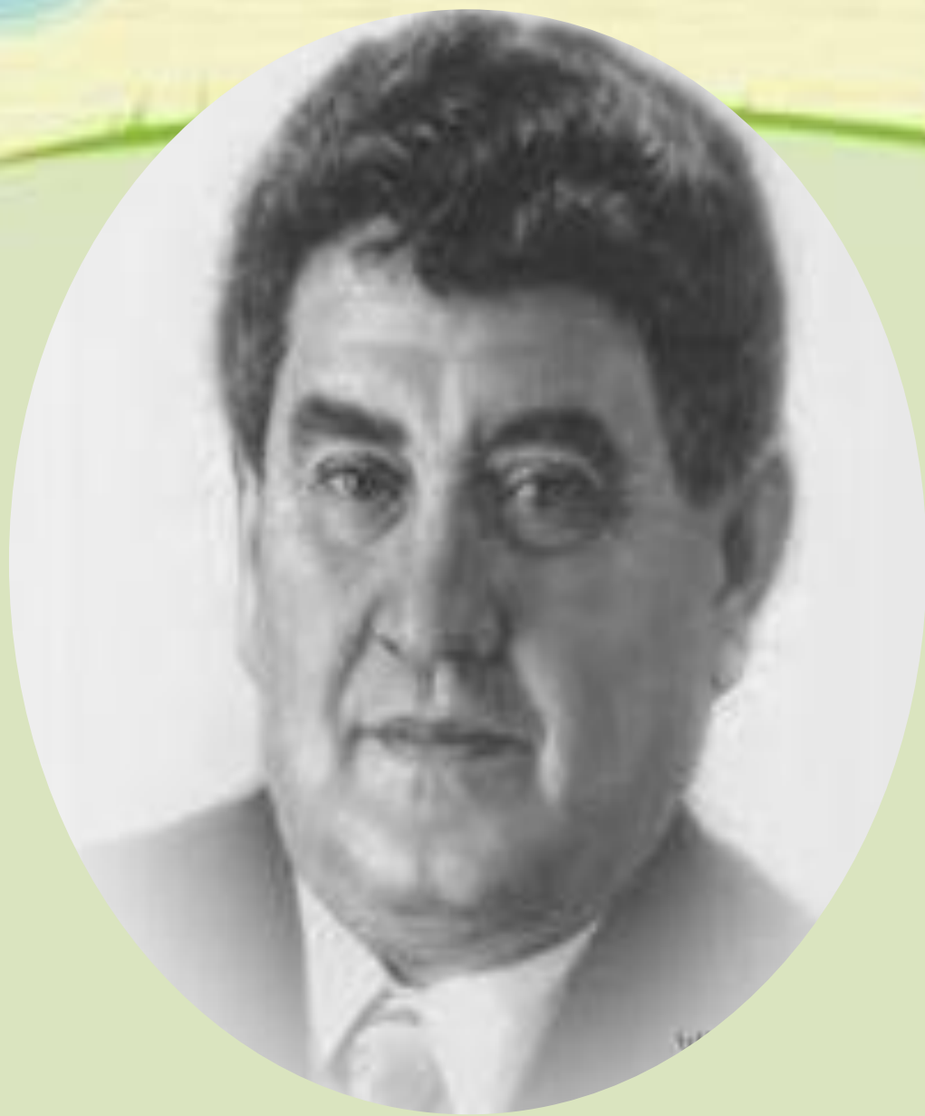
Драгунский Виктор Юзефович