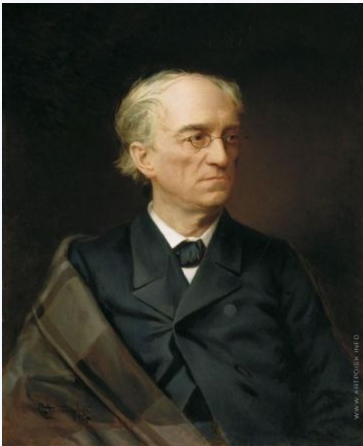
Фёдор Иванович Тютчев