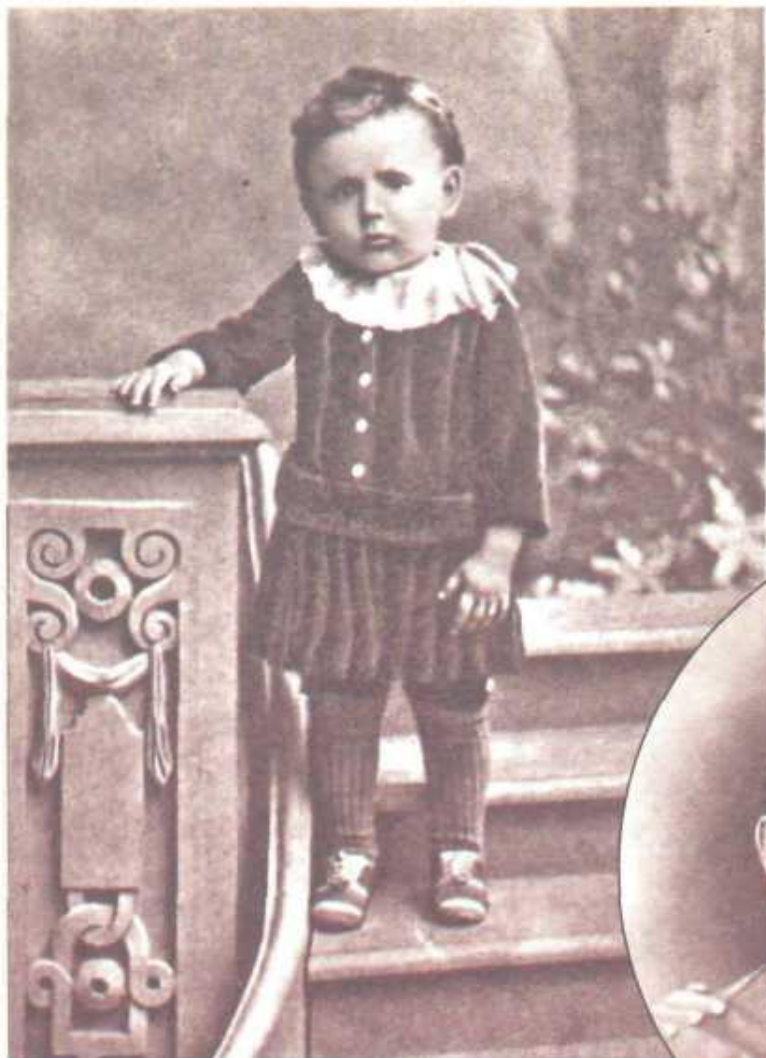
С.Я. Маршак. Около 1889 года