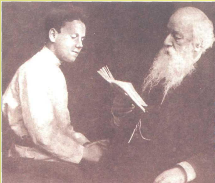
В.В. Стасов и С. Маршак