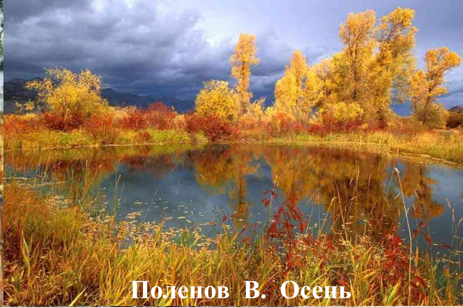
Поленов В. Осень