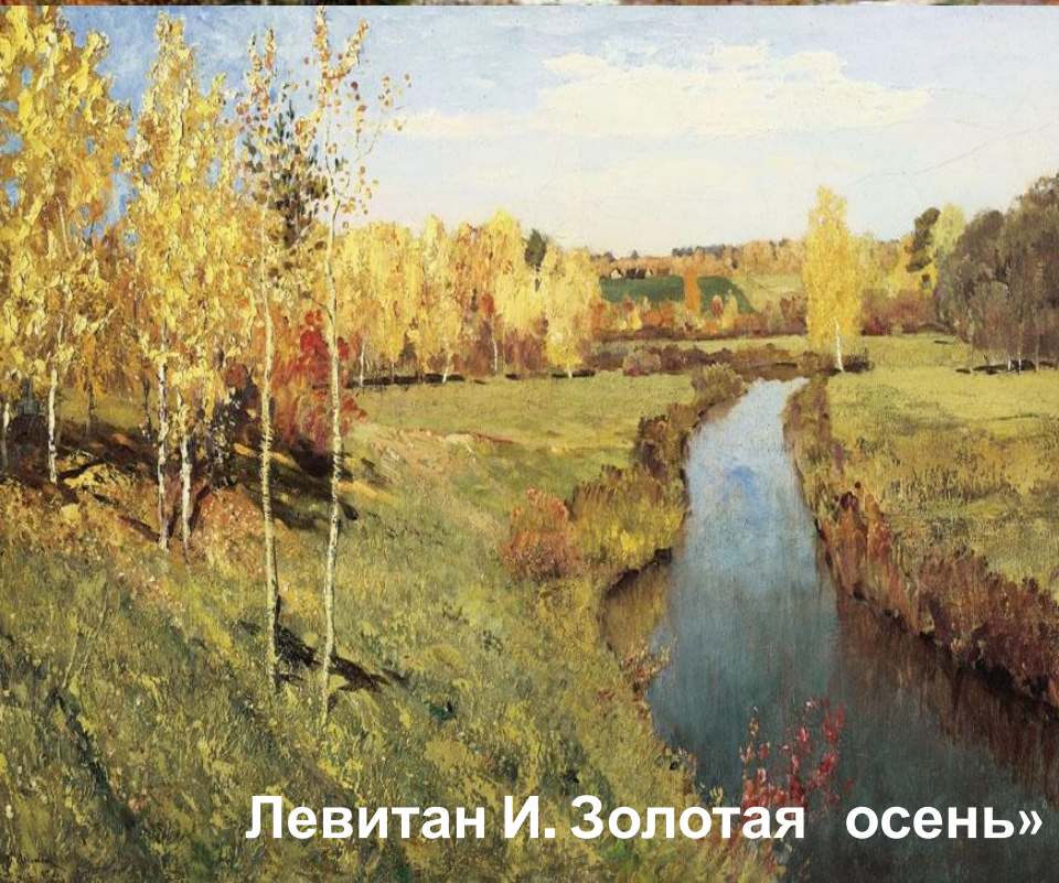
Левитан И. Золотая осень»