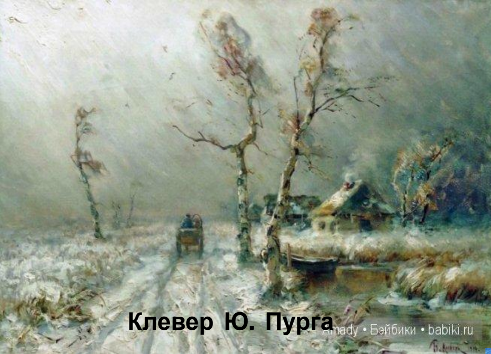
Клевер Ю. Пурга amady • Бэйбики • babiki.ru