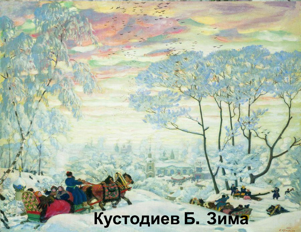
Кустодиев Б. Зима