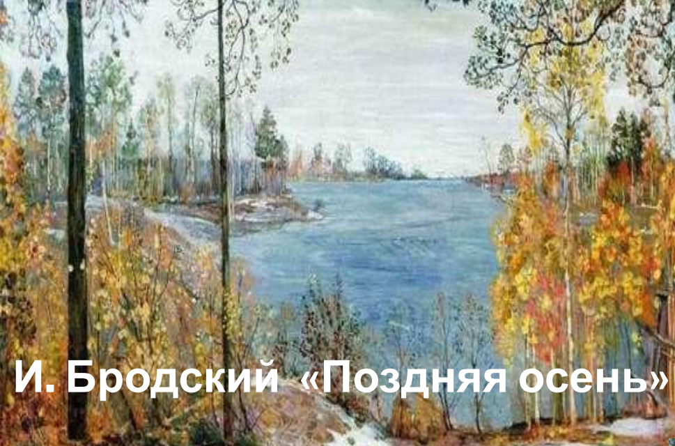
И. Бродский «Поздняя осень»