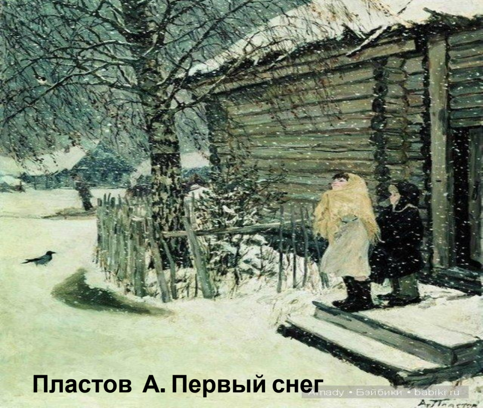
Пластов А. Первый снег