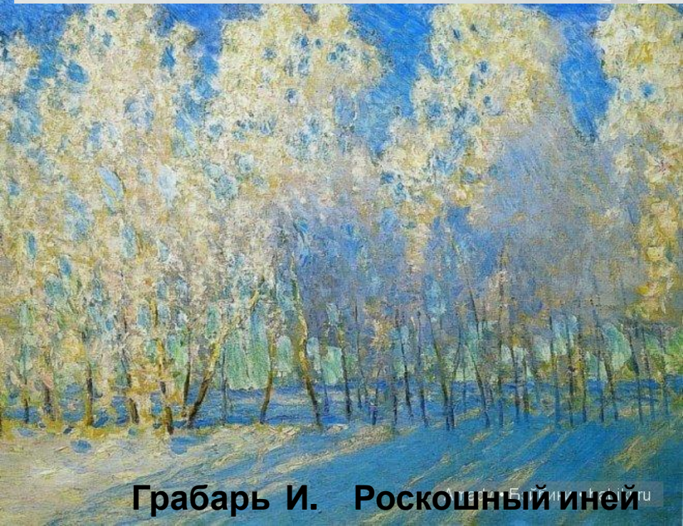
Грабарь И. Роскошный иней