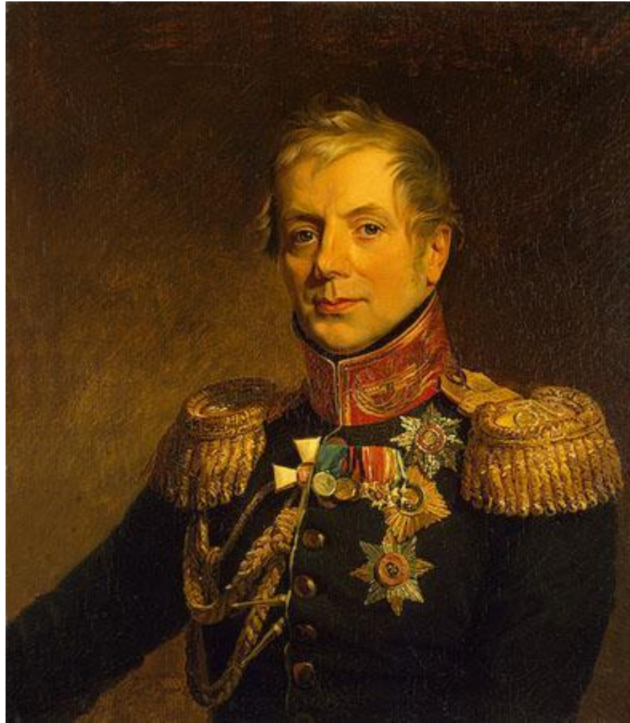
Коновницын Пётр Петрович