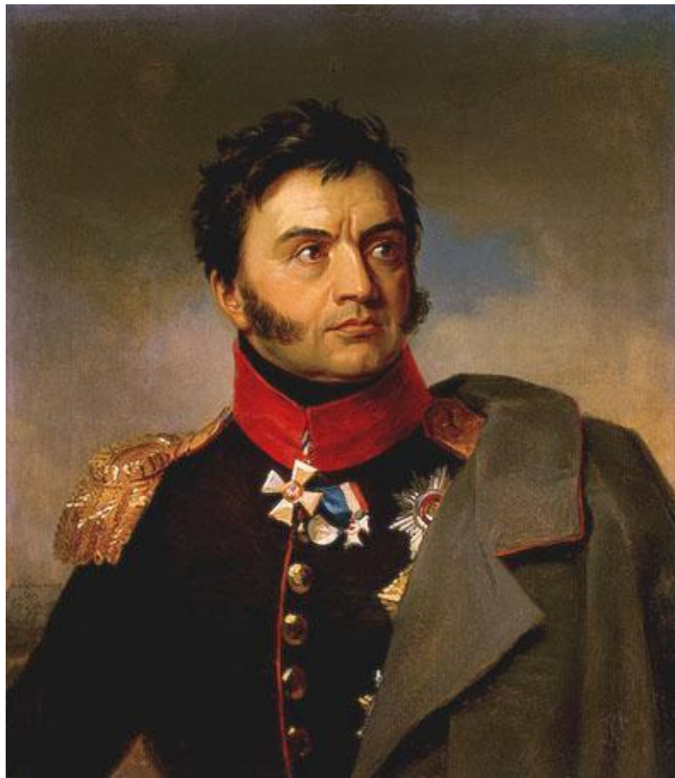
Раевский Николай Николаевич