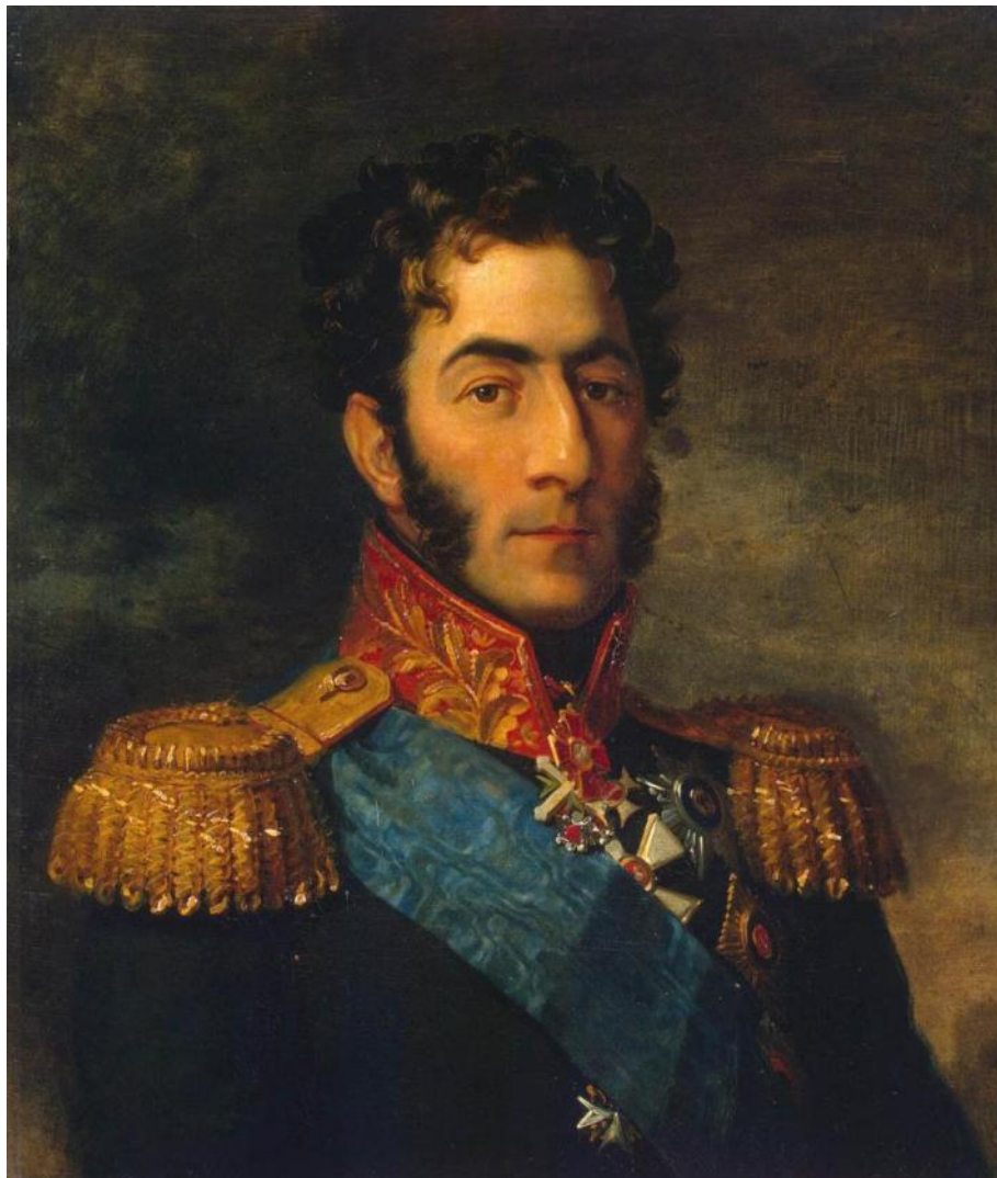
Багратион Пётр Иванович