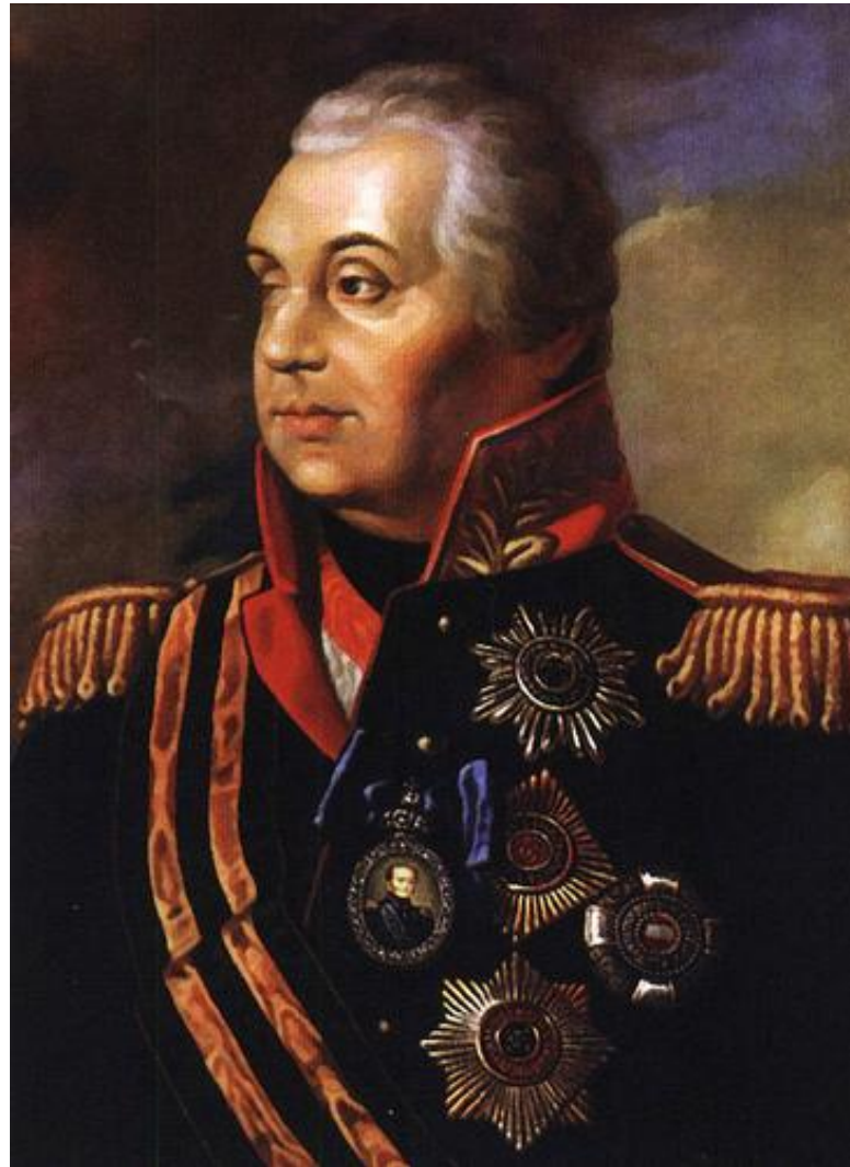
Кутузов Михаил Илларионович