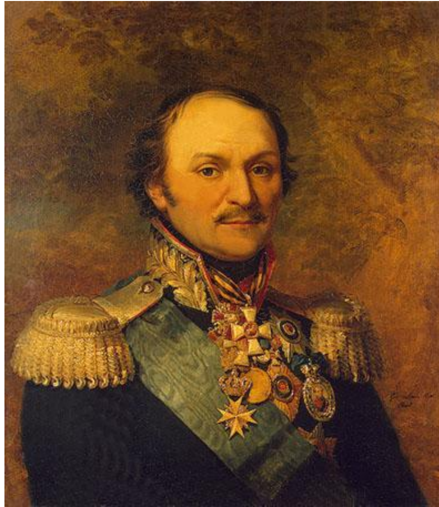
Платов Матвей Иванович