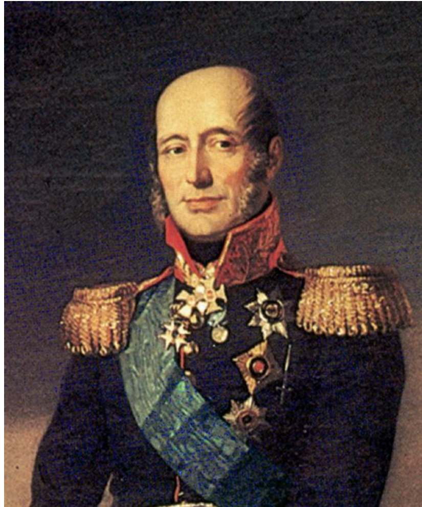
Барклай де Толли Михаил Богданович