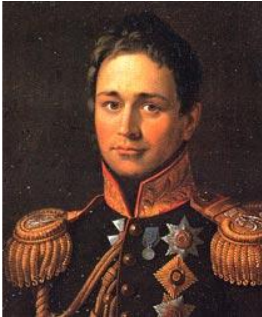
Воронцов Михаил Семёнович