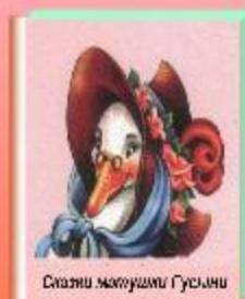
Сказки Матушки Гусыни

Где в старинном кресле, Чуть скрипя пером, Сочиняет сказки Друг мой — Шарль Перро.