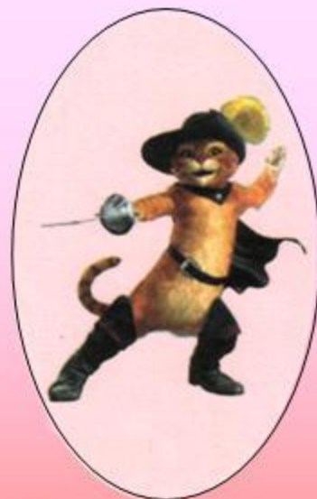
Кот в сапогах из м/ф «Шрек 2»