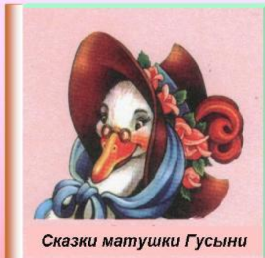
Сказки матушки Гусыни