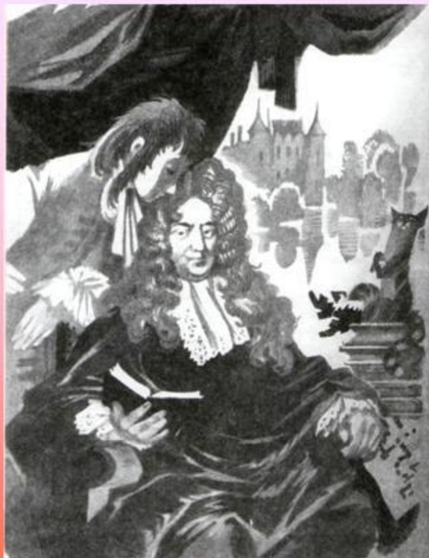
Ш. Перро с сыном. Рис. Н. Гольц