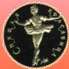
Монета «Спящая красавица» из серии «Русский балет»