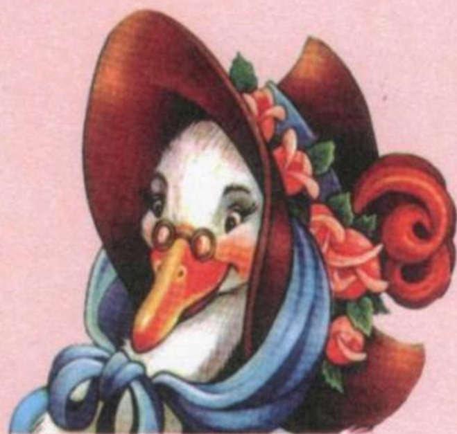
Сказки матушки Гусыни