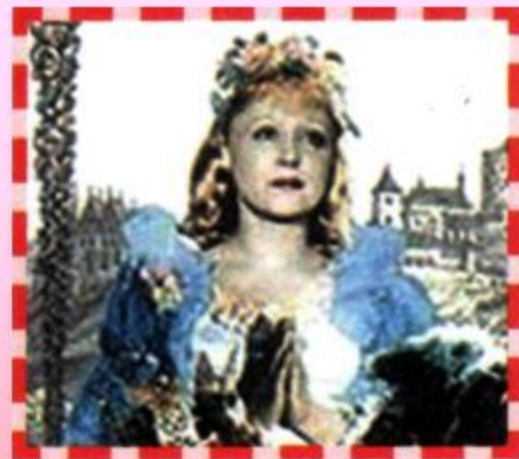
Янина Жеймо в роли Золушки в фильме-сказке «Золушка» (1947)