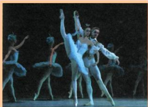
Сцена из балета «Спящая красавица»