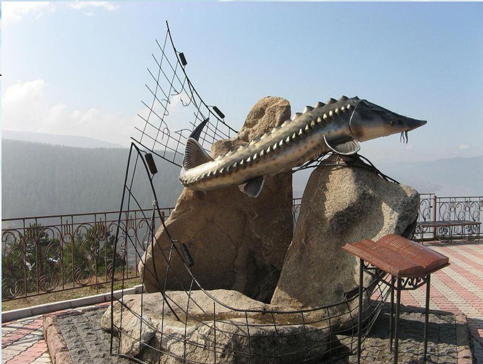
Памятник писателю возле автодороги Красноярск—Абакан