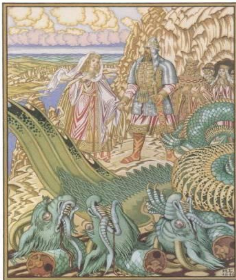
177 ДОБРЫНЯ НИКИТИЧ ОСВОБОЖДАЕТ ОТ ЗМЕЯ ГОРЫНЫЧА ЗАБАВУ ПУТЯТИСНУ. Иллюстрация к былинке. 1941