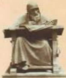
М. Антоньевский Нестор-летописец