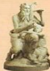
П. Велюковский Бог