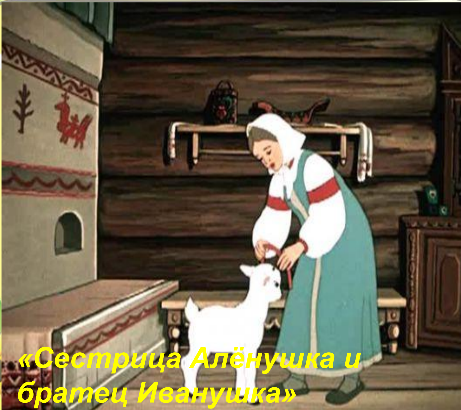
«Сестрица Алёнушка и братец Иванушка»