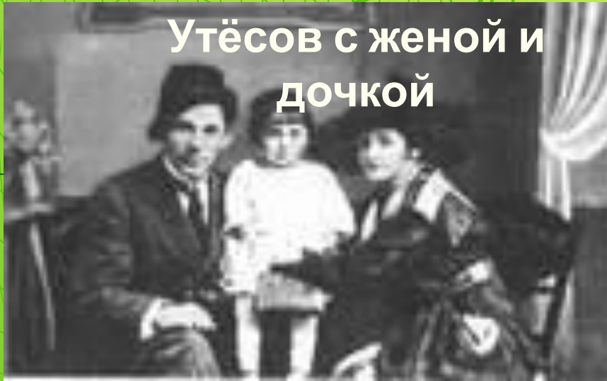
Утёсов с женой и дочкой