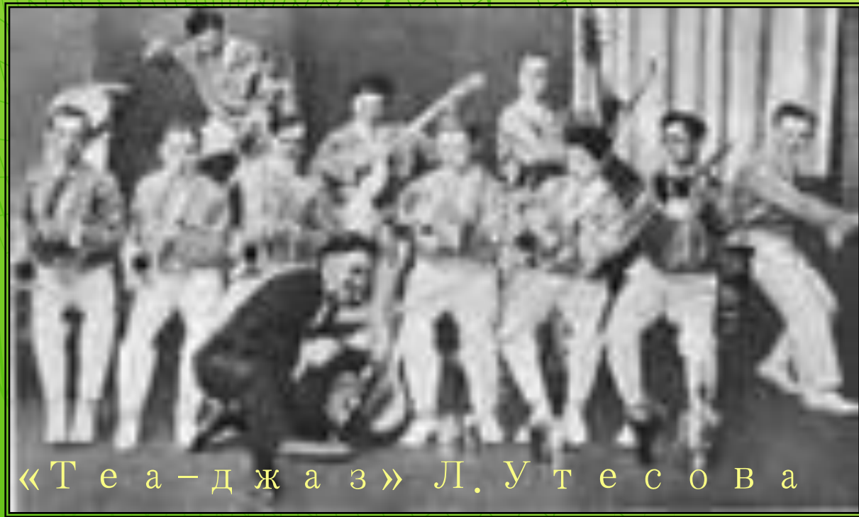
«Т е а - д ж а з» Л. У т е с о в а

собрал музыкантов и стал готовить джазовую программу. 8 марта 1929 года на сцене Малого оперного театра (г. Ленинград) дебютировал театрализованный джаз Леонида Утесова с программой «Теа-джаз».