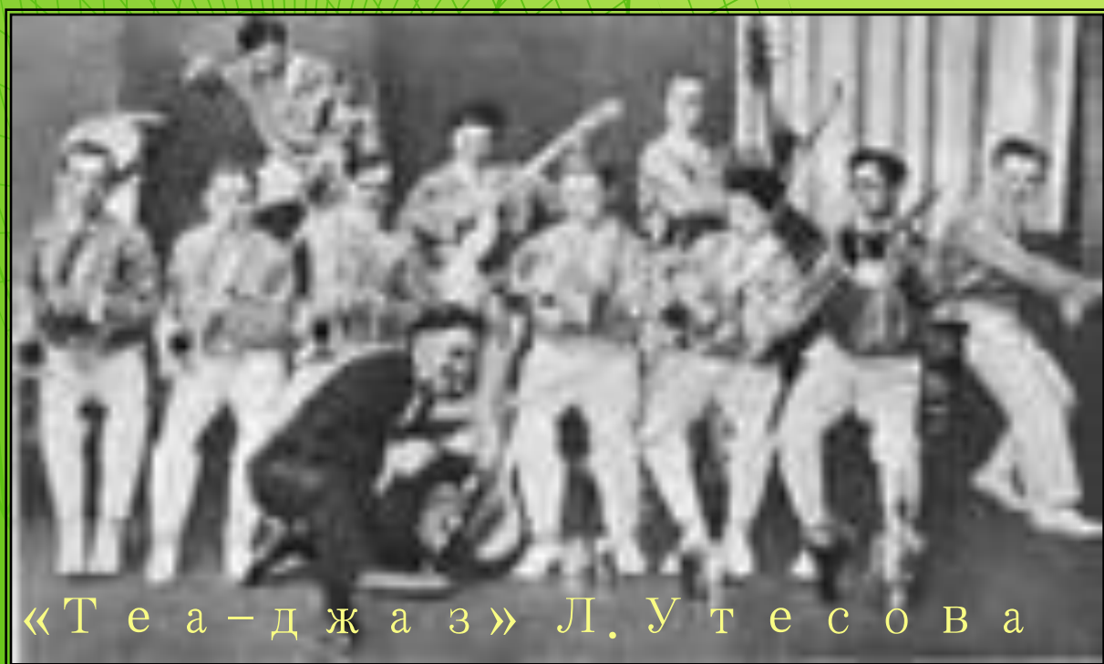
«Т е а - д ж а з» Л. У т е с о в а

собрал музыкантов и стал готовить джазовую программу. 8 марта 1929 года на сцене Малого оперного театра (г. Ленинград) дебютировал театрализованный джаз Леонида Утесова с программой «Теа-джаз».