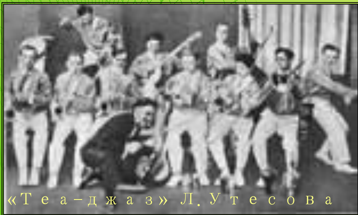
«Т е а - д ж а з» Л. У т е с о в а

собрал музыкантов и стал готовить джазовую программу. 8 марта 1929 года на сцене Малого оперного театра (г. Ленинград) дебютировал театрализованнный джаз Леонида Утесова с программой «Теа-джаз».