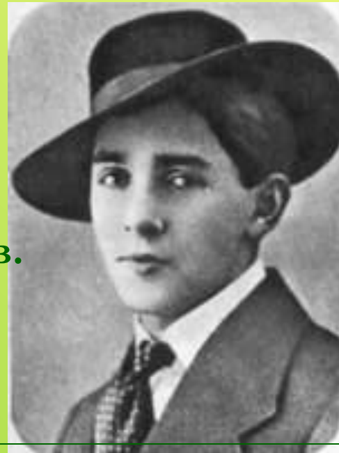
А.Утесов 1911 год

В 1912 году устроился в Кременчугский театр миниатюр; тогда же взял сценический псевдоним Утесов.