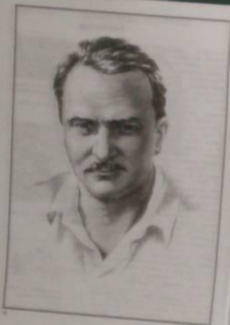
Виталий Валентинович Бианки 1894-1958

Виталий Валентинович Бианки (1894-1958) — русский писатель, натуралист, автор популярных книг о природе. Он был первым в СССР, кто начал писать о животных с точки зрения их поведения и жизни в природе. Его книги, такие как «Паучок-пилот», «Скворец», «Сорока», «Ворона», «Лягушка», «Заяц», «Лиса», «Волк», «Медведь», «Белка», «Птицы», «Рыбы», «Насекомые», «Растения», «Грибы», «Моллюски», «Пауки», «Змеи», «Ящерицы», «Черепахи», «Плоские черви», «Кольчатые черви», «Моллюски», «Ракообразные», «Насекомые», «Рыбы», «Птицы», «Млекопитающие», «Земноводные», «Пресмыкающиеся», «Земноводные», «Птицы», «Млекопитающие», «Земноводные», «Пресмыкающиеся».