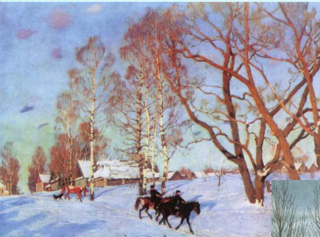
Н.Крылов «Русская зима»