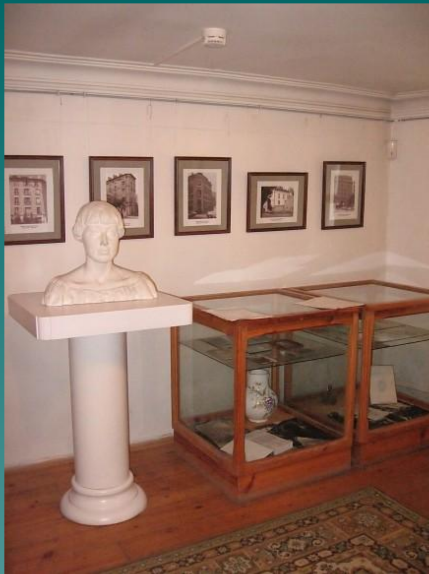
Кухня, превращенная в выставочный зал