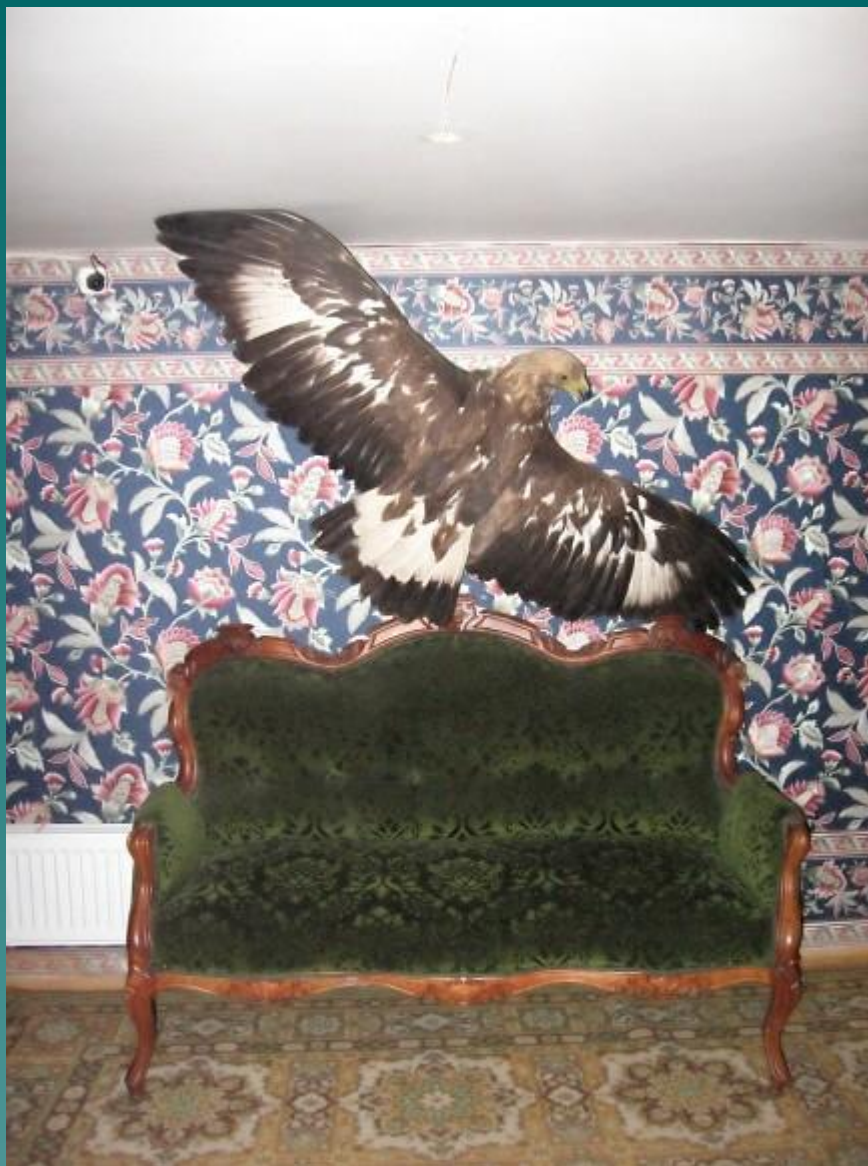
Комната Сергея Эфрона