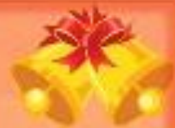
Валентина Александровна Осеева