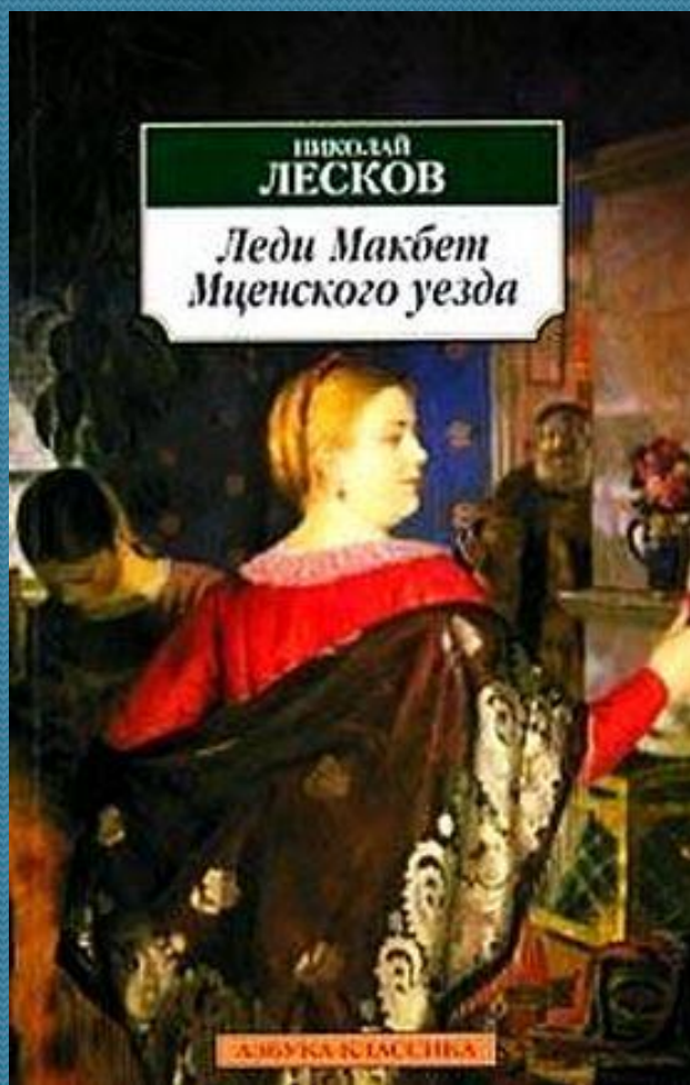
повесть Лескова «Леди Макбет Мценского уезда»