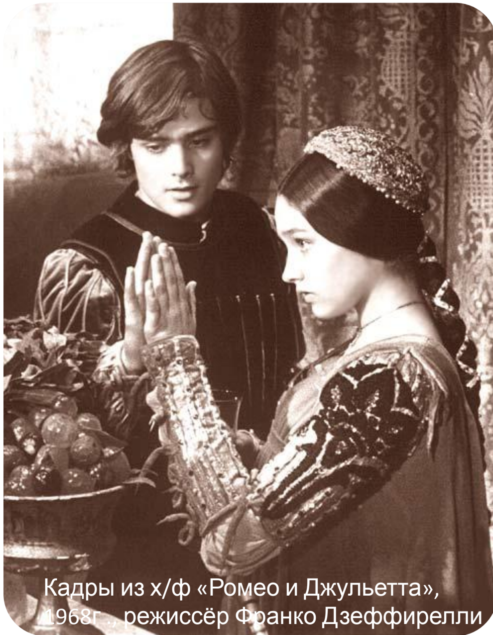
Кадры из х/ф «Ромео и Джульетта», 1968г., режиссёр Франко Дзеффирелли

Любовь всегда прекрасна и желанна, Особенно, когда она нежданна.