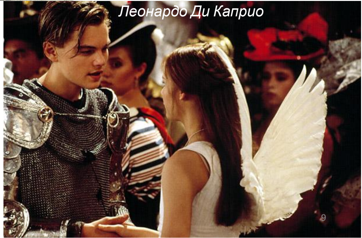
Леонардо Ди Каприо