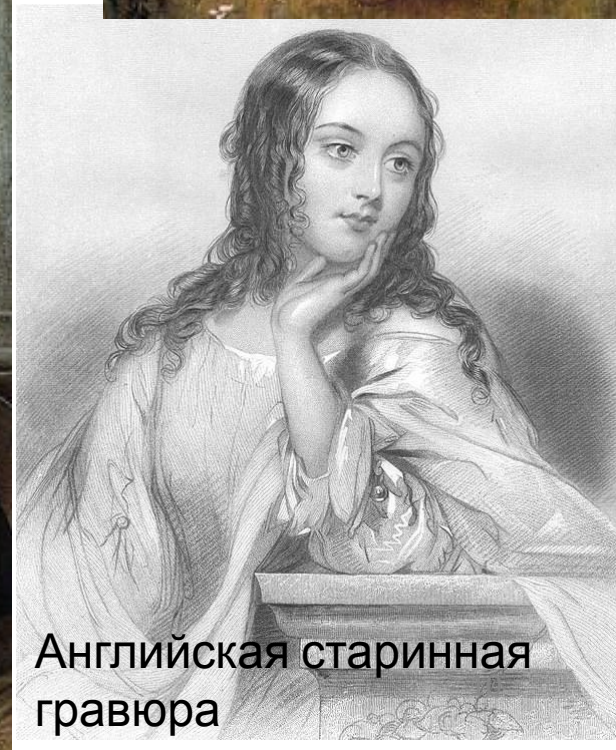
Английская старинная гравюра