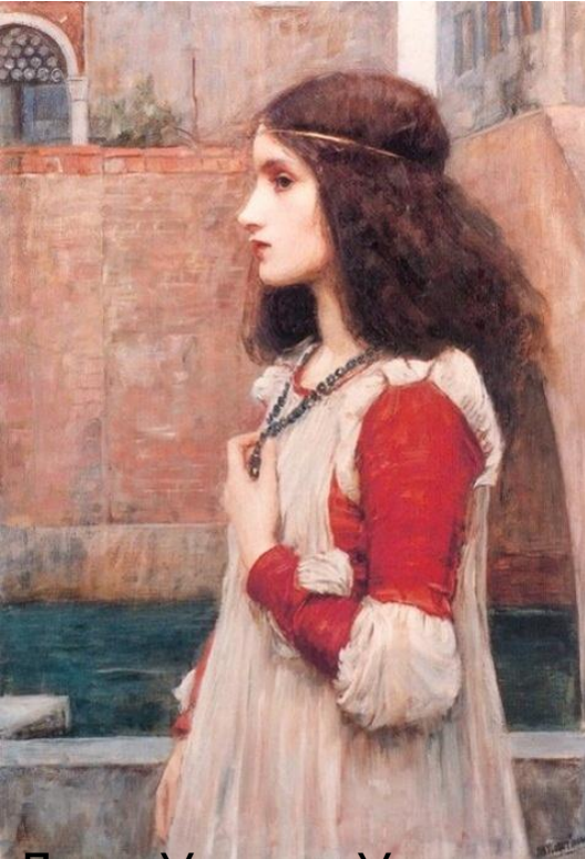
Джон Уильям Уотерхауз