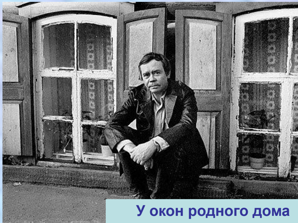
У окон родного дома

Танька, не задумываясь, отправляется на похороны с бабушкой, чтобы не оставить её один на один с бедой, с горем. Есть в молодёжи те нравственные устои, которые нужны, чтобы не потерять себя, свою совесть на трудном жизненном пути.