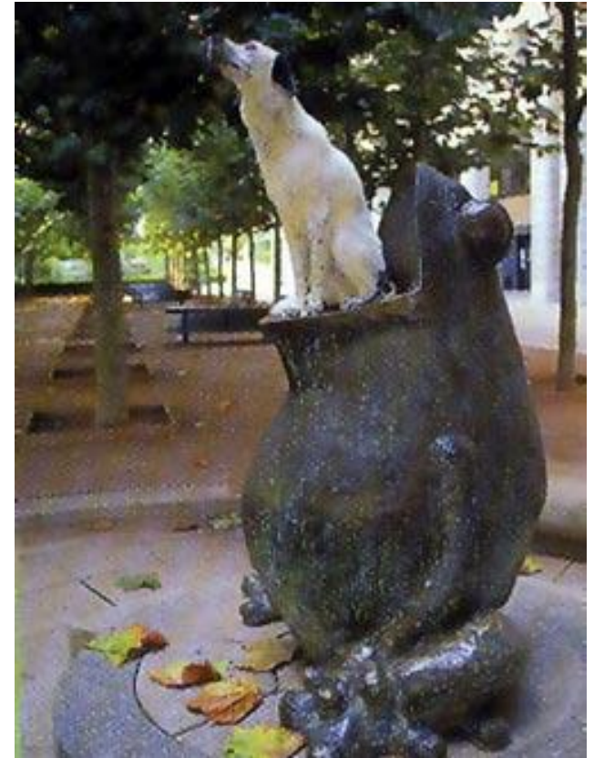
Памятник лягушке возле здания Института Пастера в Париже.