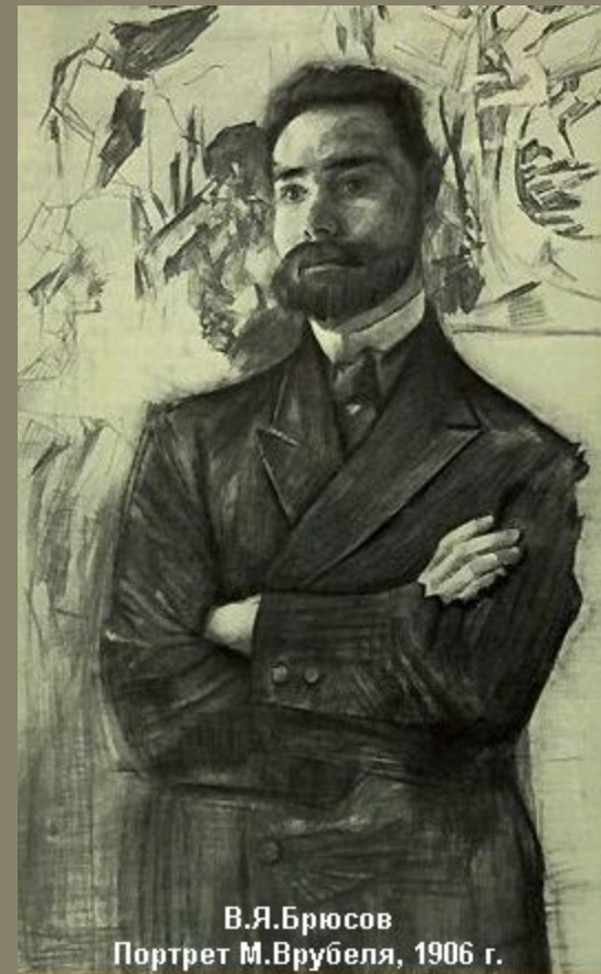
В.Я.Брюсов Портрет М.Врубеля, 1906 г.

Черные горящие глаза поэта, по - наполеоновски сложенные руки, очертания темного сюртука выражают непреклонную волю и скрытую страстность вождя русского символизма.