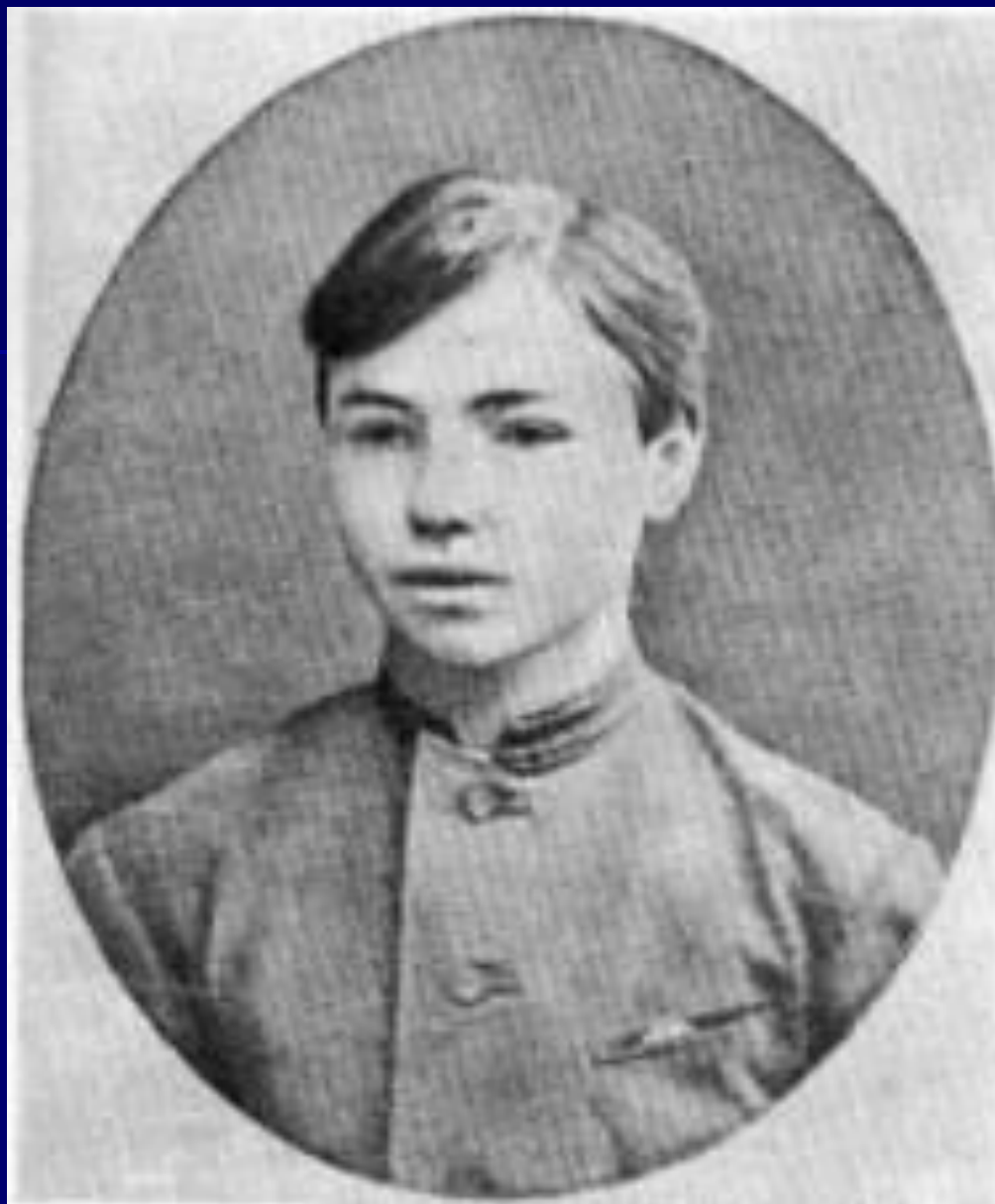
В.Я. Брюсов в детстве