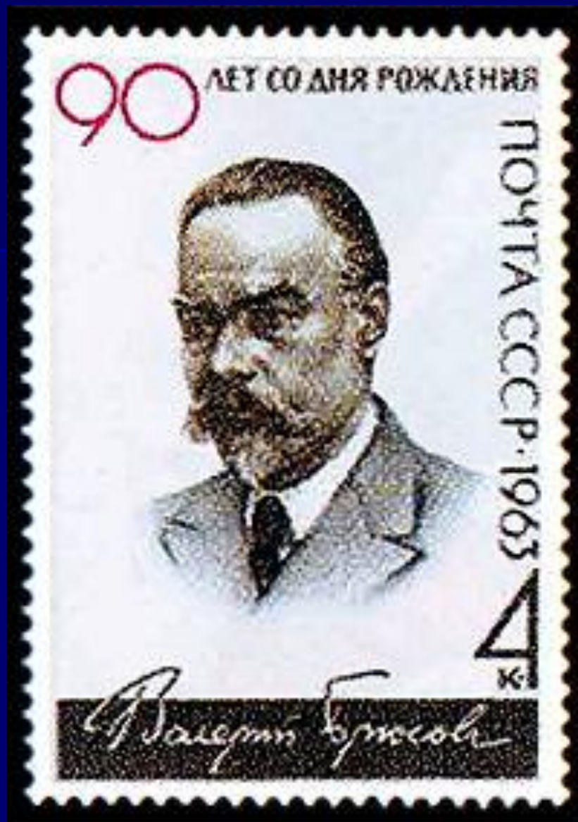
Почтовая марка СССР из серии «Писатели нашей Родины», посвящённая В. Я. Брюсову, 1963