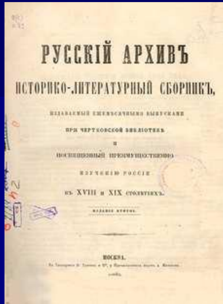
Журнал «Русский архив»