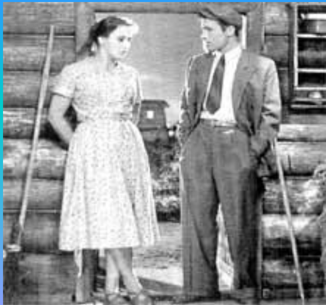
«Живет такой парень»