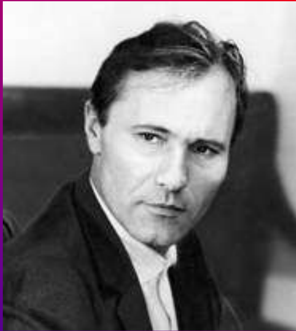
Василий Макарович Шукшин (1927 - 1974)