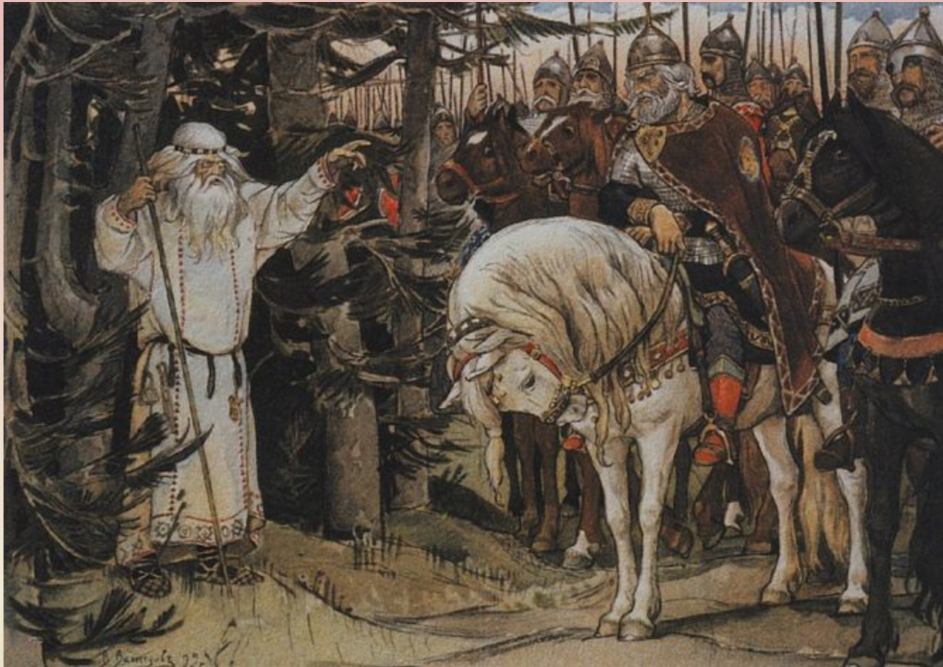
Встреча Олега с кудесником

Конец 1890-х годов был отмечен работой Васнецова над иллюстрациями к "Песне о вещем Олеге" Пушкина для академического издания к столетию со дня рождения поэта.