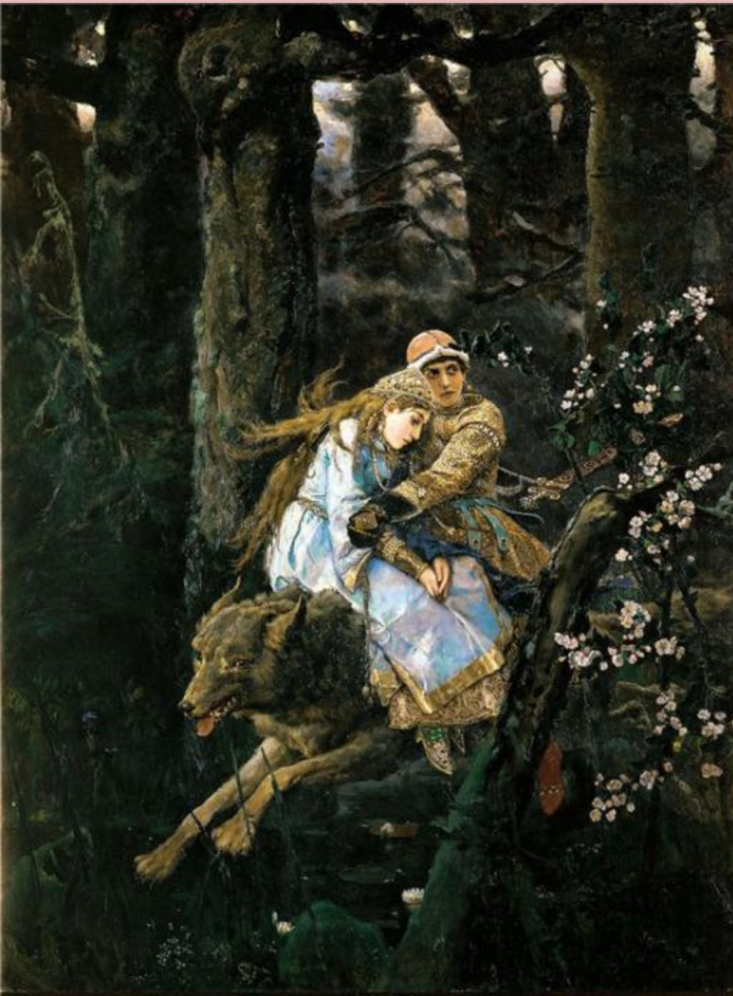
"Иван Царевич на сером волке" Дата: 1889 г.