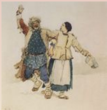
Бобыль и Бобылиха