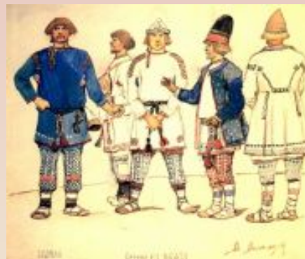
Брусила и берендеи ребята