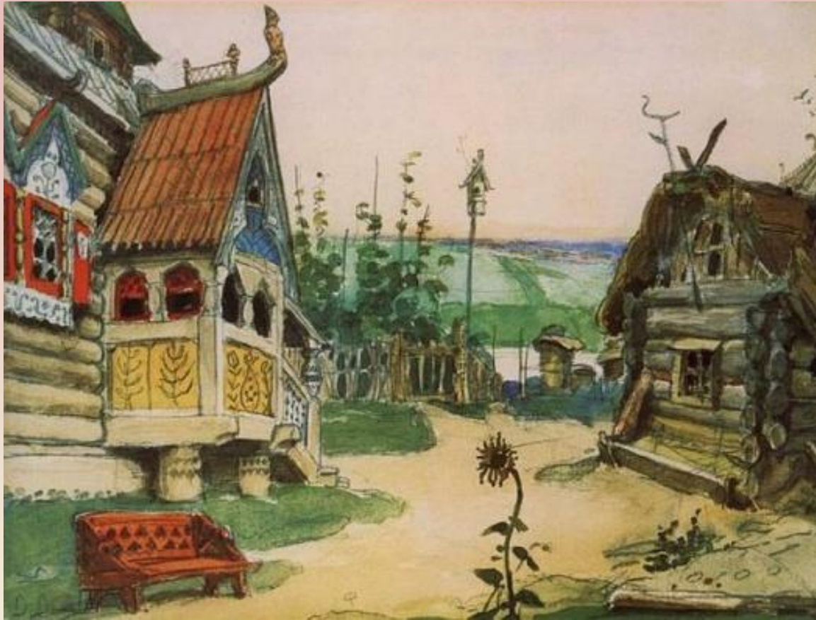
Заречная слободка Берендеевка Эскиз декорации к опере Н.А.Римского- Корсакова "Снегурочка" 1885г, холст, масло, Государственная Третьяковская галерея, Москва.

Когда Репин увидел декорации и костюмы В. Васнецова к опере «Снегурочка», то написал Стасову: «Васнецов сделал для костюмов рисунки. Он сделал такие великолепные типы - восторг... я уверен, что никто там у вас не сделает ничего подобного. Это просто шедевр».