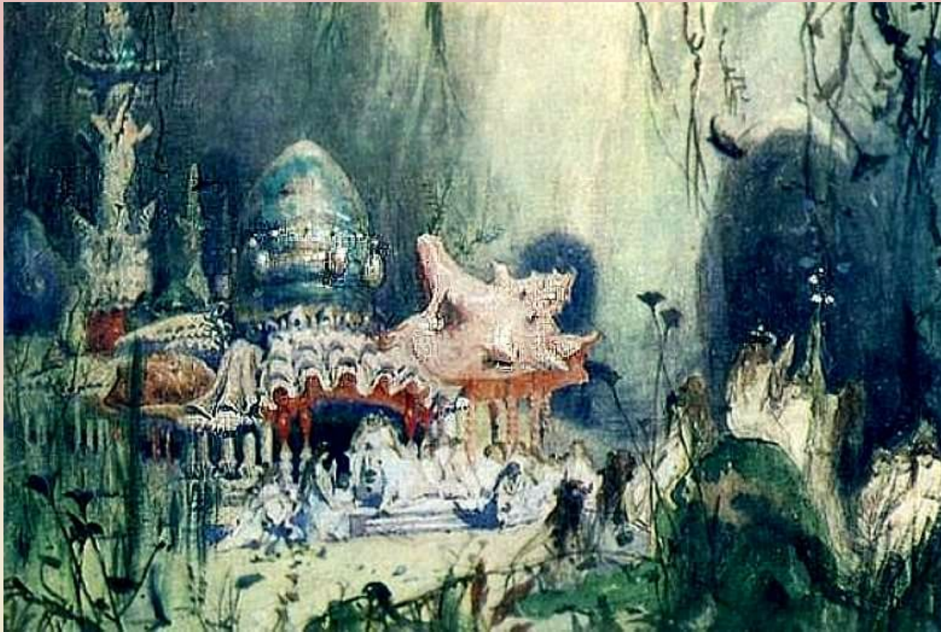
В. Васнецов. Подводный терем

1884, Эскиз декорации к опере А.С.Даргомыжского "Русалка", Дом-музей В.М.Васнецова