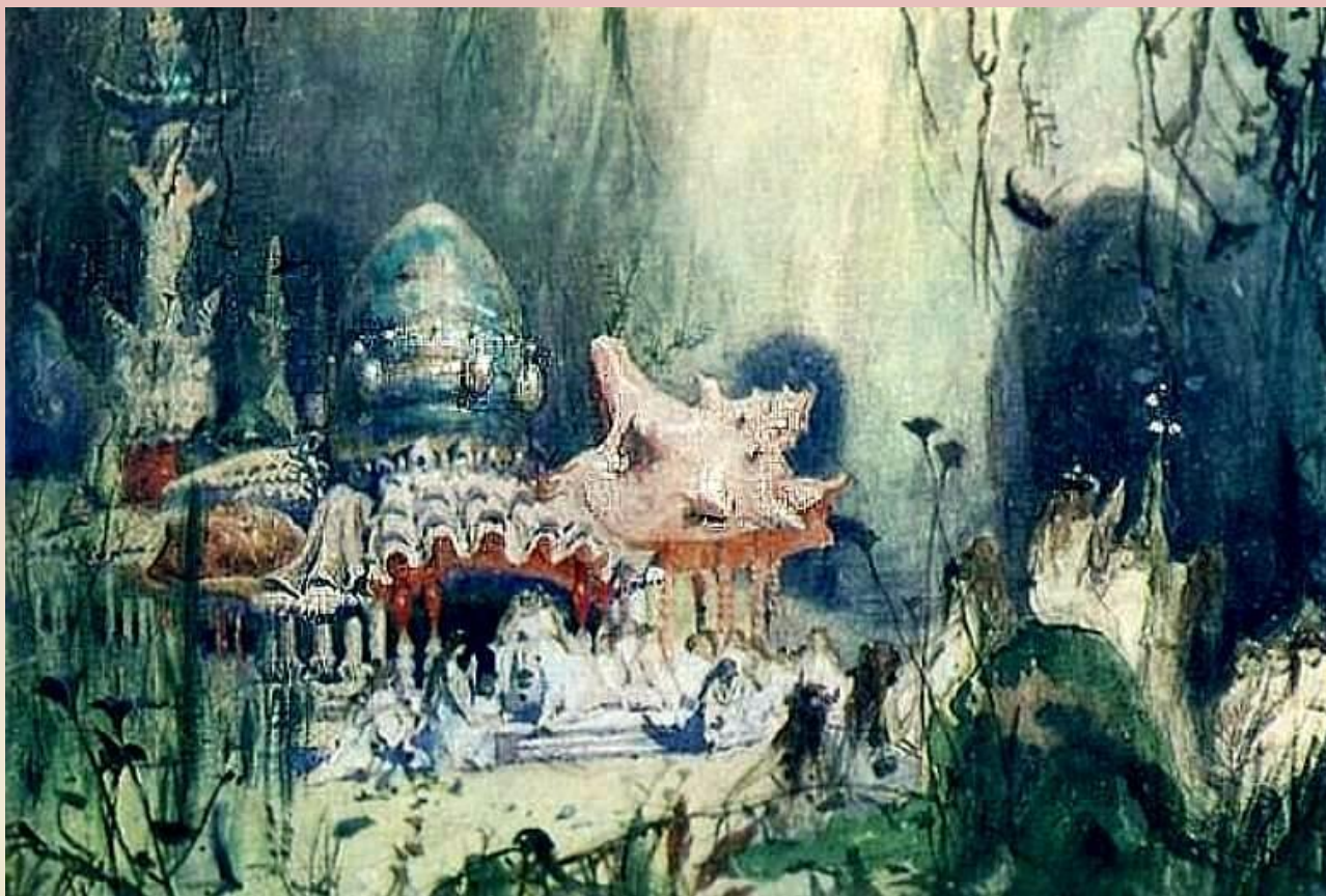
В. Васнецов. Подводный терем

1884, Эскиз декорации к опере А.С.Даргомыжского "Русалка", Дом-музей В.М.Васнецова