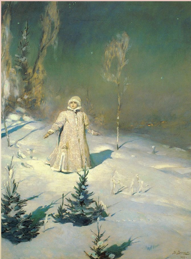
В.М.Васнецов. "Снегурочка". 1899 г. Государственная Третьяковская галерея, Москва