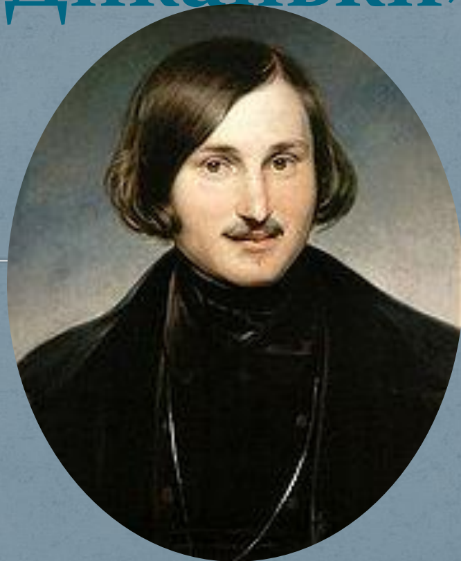
Н. В. Гоголь