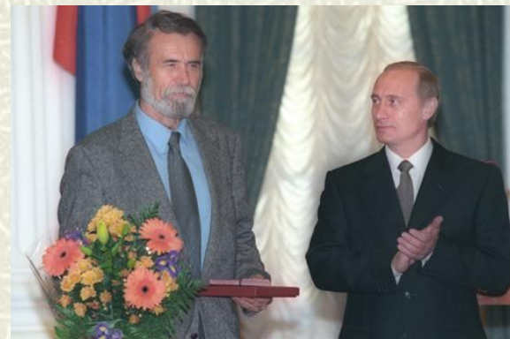
В.Маканин и В. Путин

Литература изменила свой курс. В литературе происходят глубинные процессы. Искусство стало как правдоискательство. Стремление к истине, поиск духовных основ.