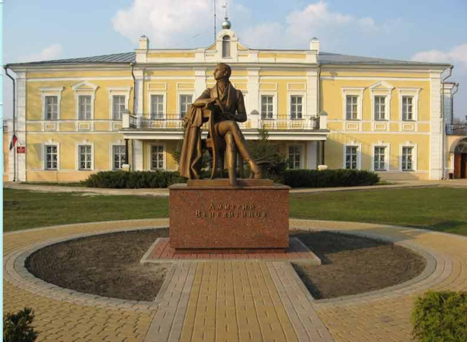
ПАМЯТНИК ВЕНЕВИТИНУ ДМИТРИЮ ВЛАДИМИРОВИЧУ