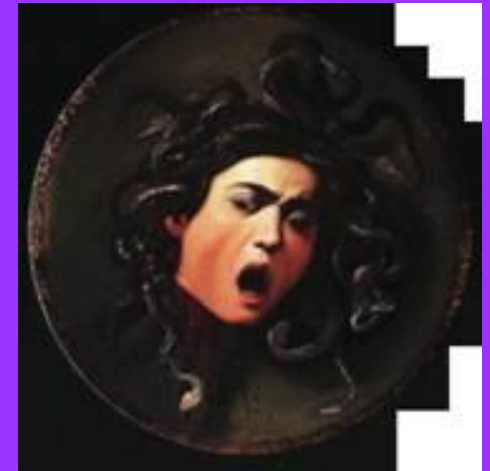
Караваджо, Голова Медузы, ок. 1581. Флоренция, Галерея Уффици