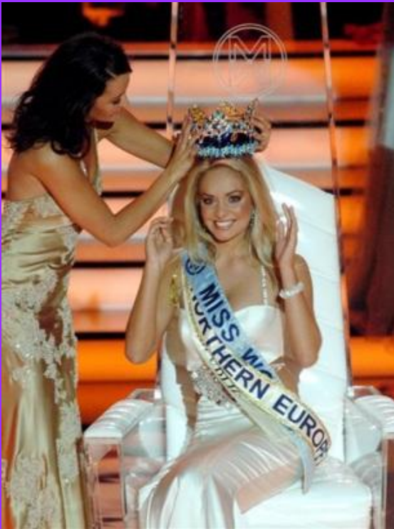
Мисс Мира 2006-Чехия

Слот 3 «Обманчивое восприятие внешности»