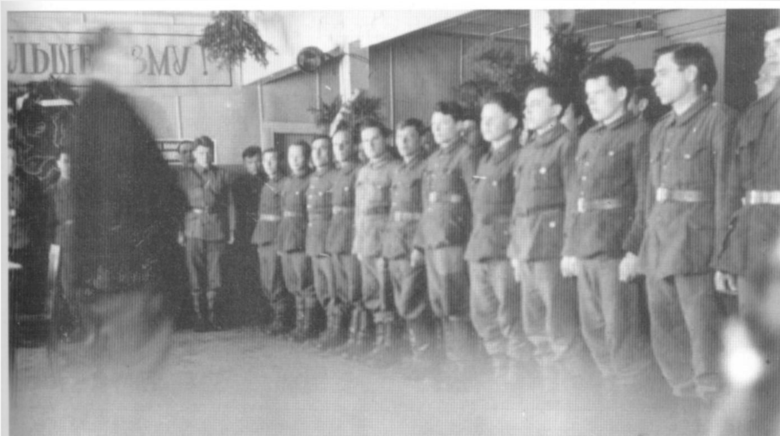
Курсанты Петрозаводской школы финской разведки