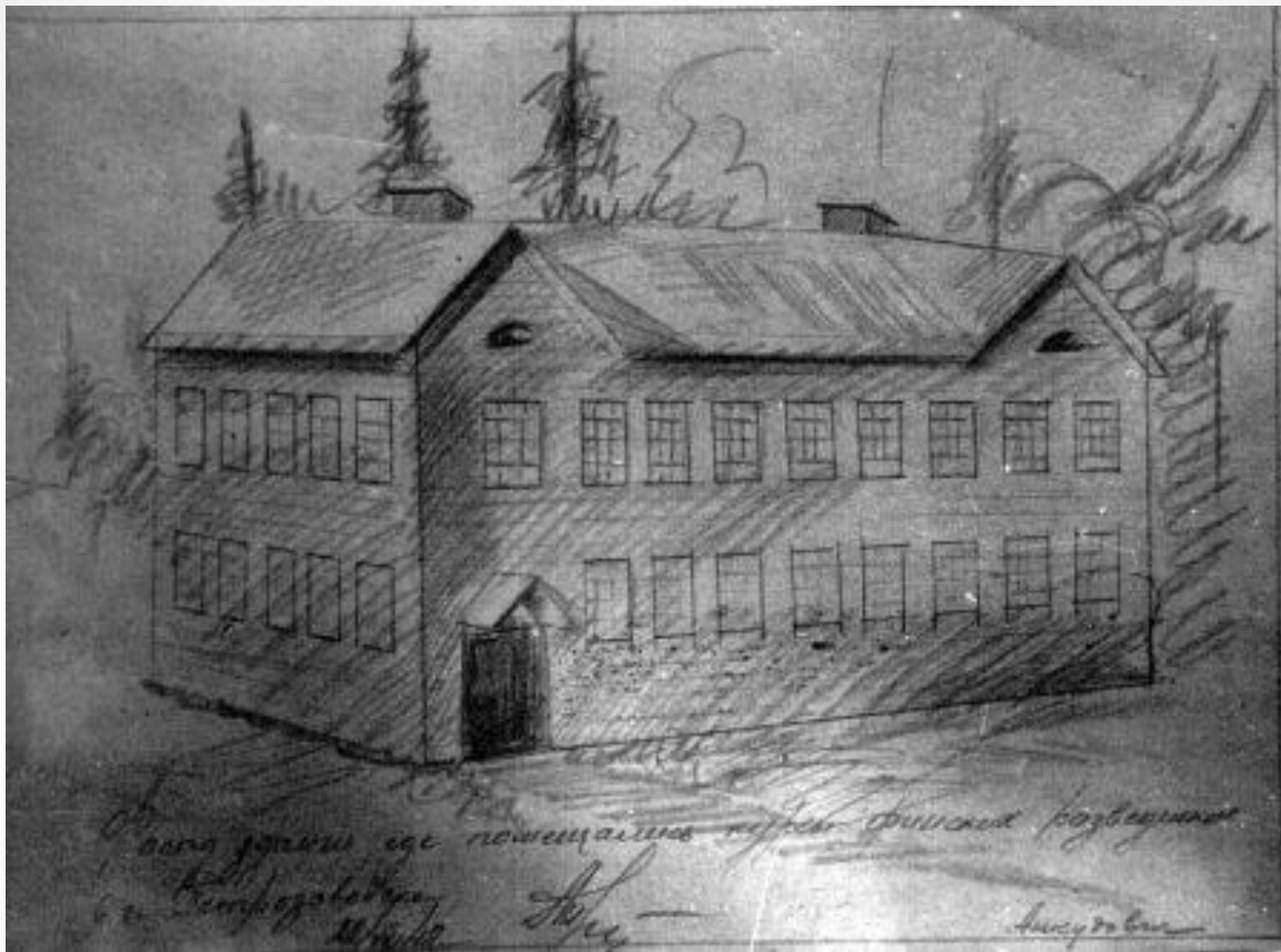
Рисунок здания Петрозаводской разведшколы, Автор - курсант А.В. Анкудович, июль 1942 г.