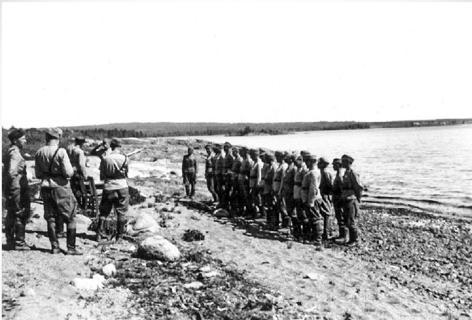
Церемония награждения курсантов Петрозаводской школы финской разведки, 1943 г., берег оз. Шотозеро.