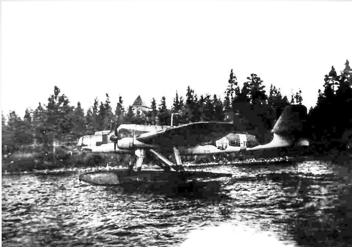
Самолет на оз. Укшезеро (Косалма), откуда финские разведчики разведывательно-диверсионного отряда майора Куйсманена забрасывались в тыл РККА в 1942–1943 гг.