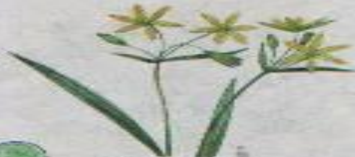
ТУСНЬ ПЛ. СР.