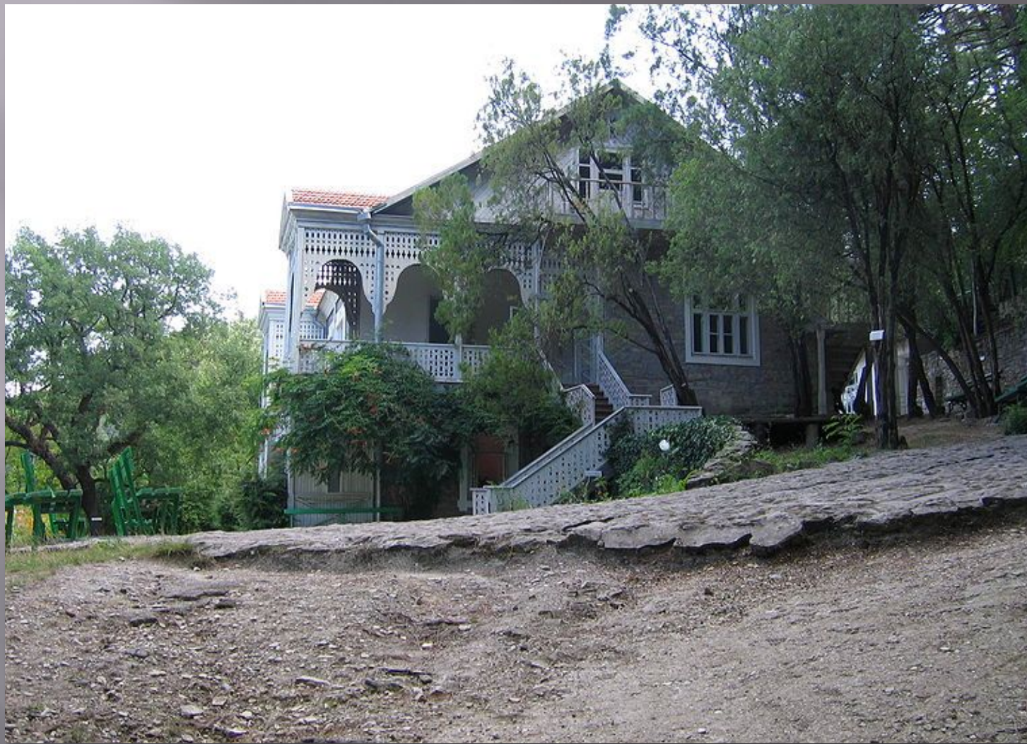
Вид на дачу от входа в музей