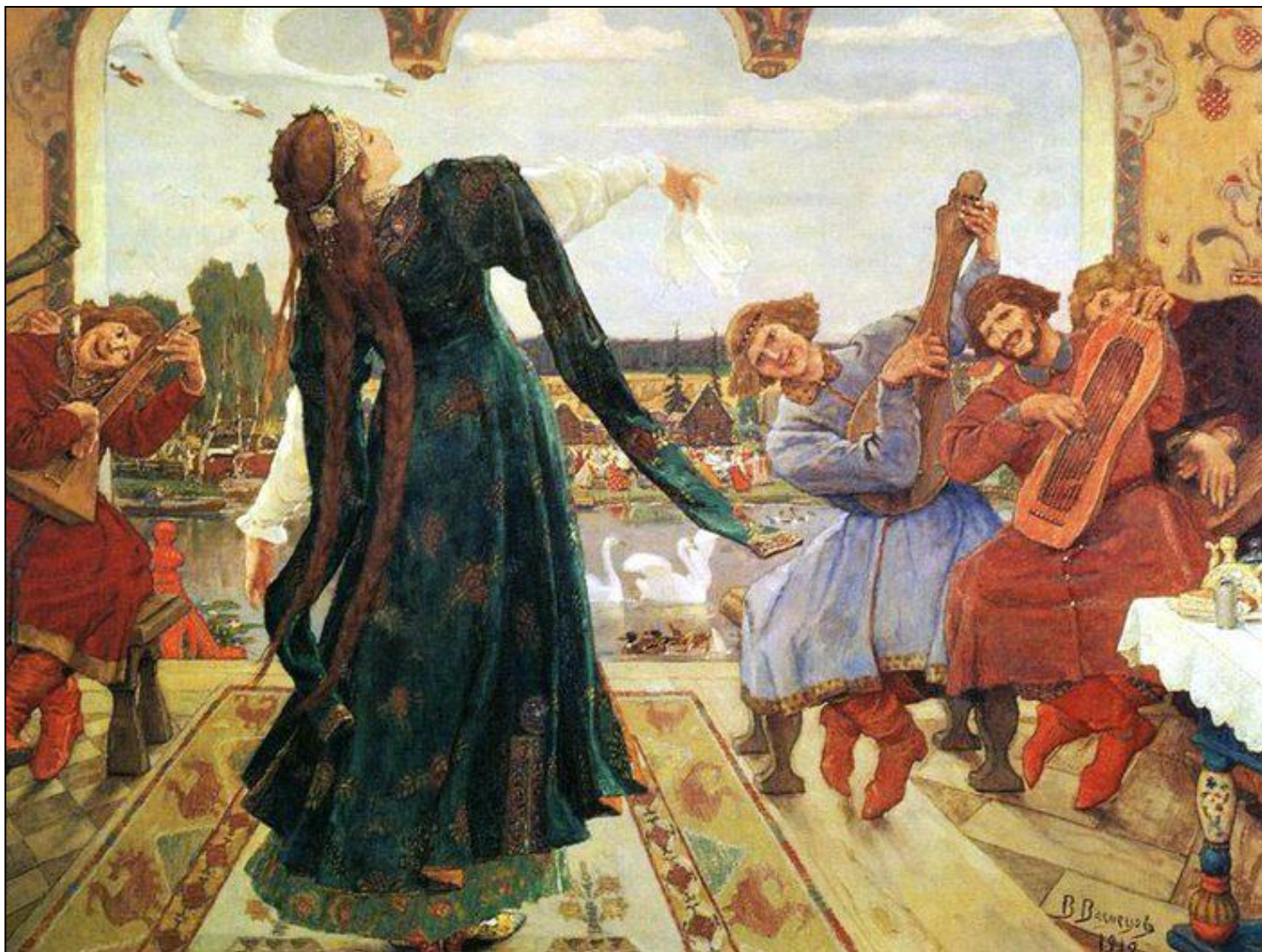
«Царевна-лягушка» (1918, Дом-музей В. М. Васнецова в Москве)