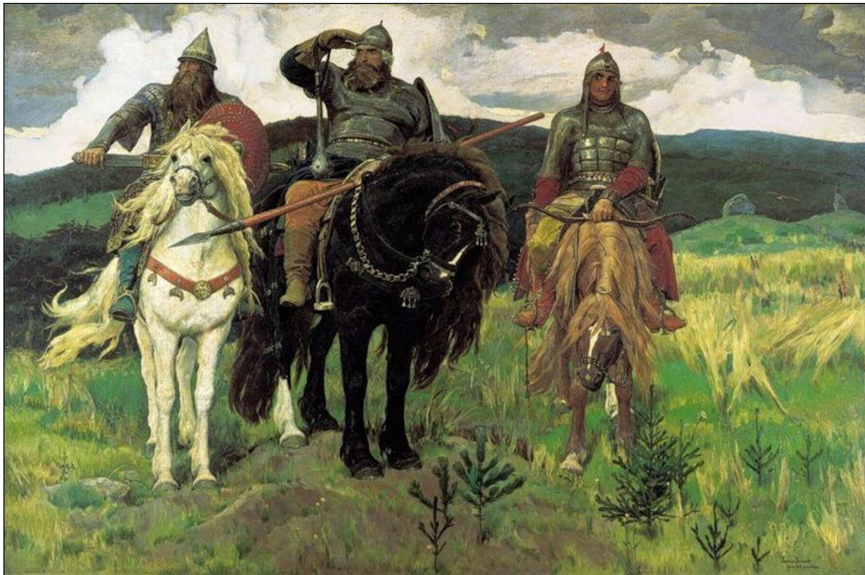
«Богатыри» (1898, ГТГ)