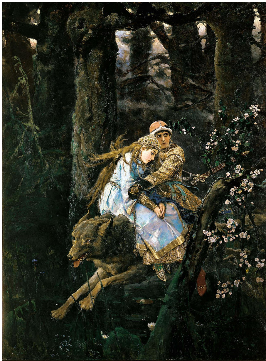
«Иван-царевич и Серый волк» (1889, ГТГ)