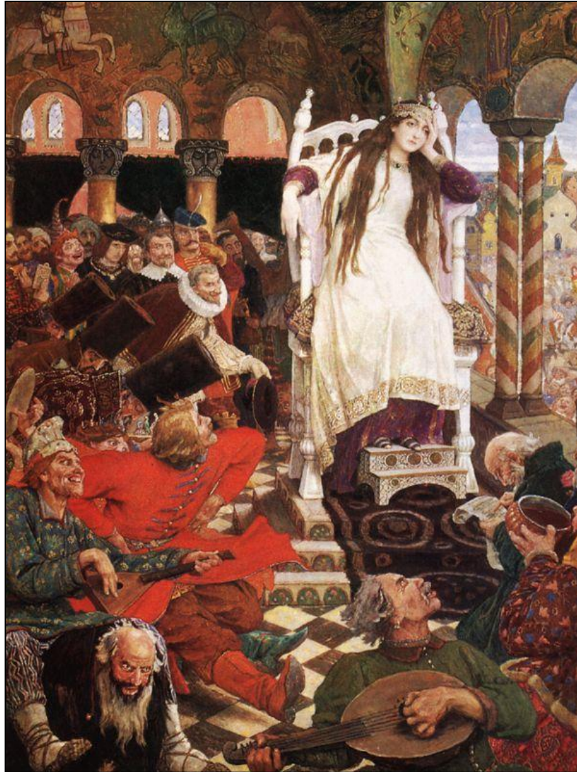
«Царевна-Несмеяна» (1916 – 1926, Дом-музей В. М. Васнецова в Москве)