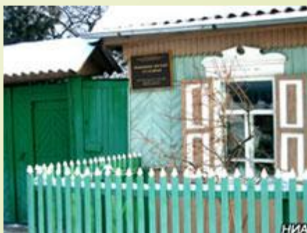
Дом-музей В.П. Астафьева