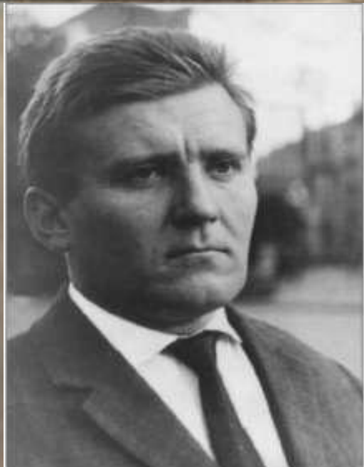
Виктор Владимирович Голявкин