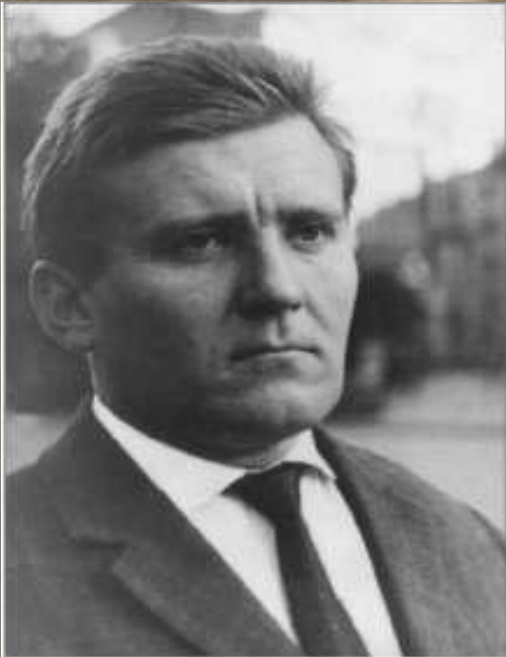
Виктор Владимирович Голявкин