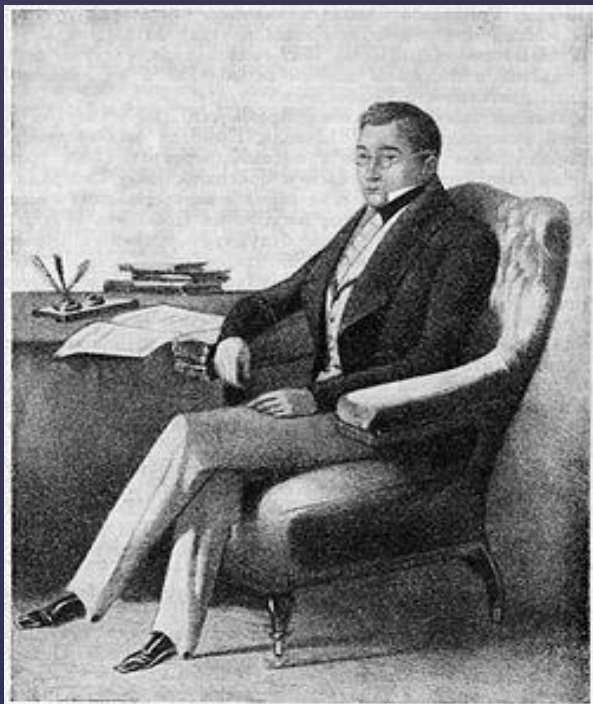
Александр Сергеевич Грибоедов