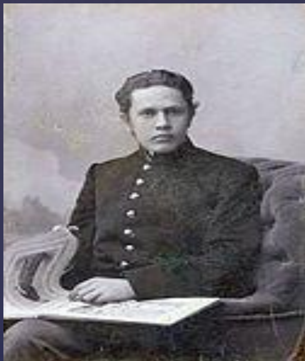
Алексей Николаевич Толстой