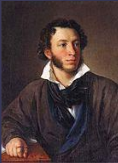
Александр Сергеевич Пушкин