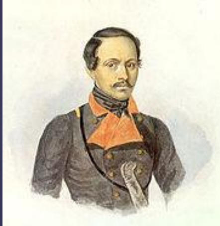
Михаил Юрьевич Лермонтов