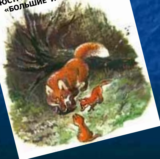
ИЛЛЮСТРАЦИЯ К КНИГЕ Е. ЧАРУШИНА «БОЛЬШИЕ И МАЛЕНЬКИЕ»