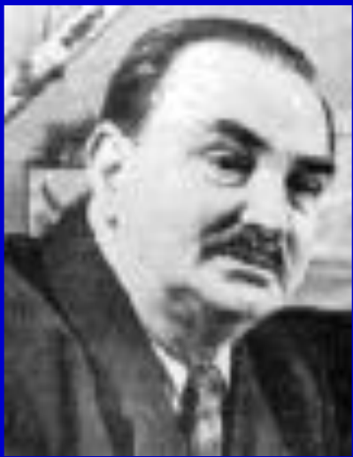
Виталий Валентинович Бианки