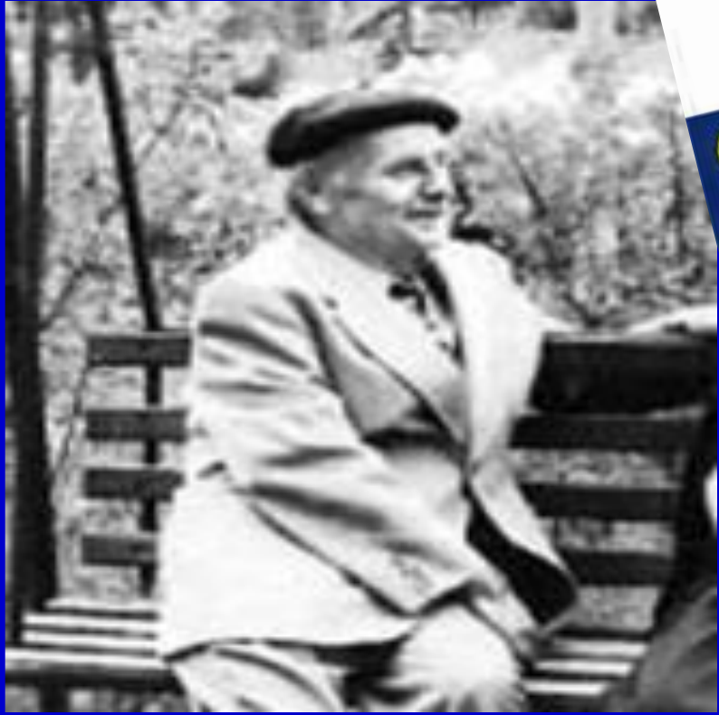
Владимир Григорьевич Сутеев