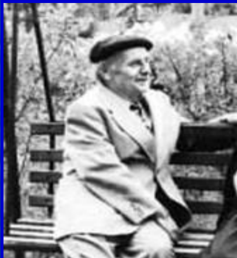
Владимир Григорьевич Сутеев