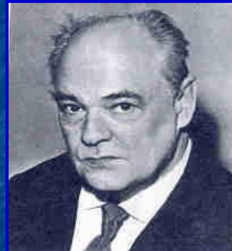
Евгений Иванович Чарушин