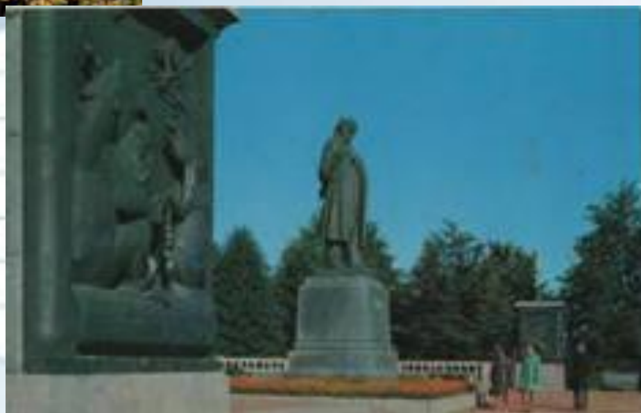
Памятник И.А. Крылову.

Басни его высмеивают не людей, а их пороки :