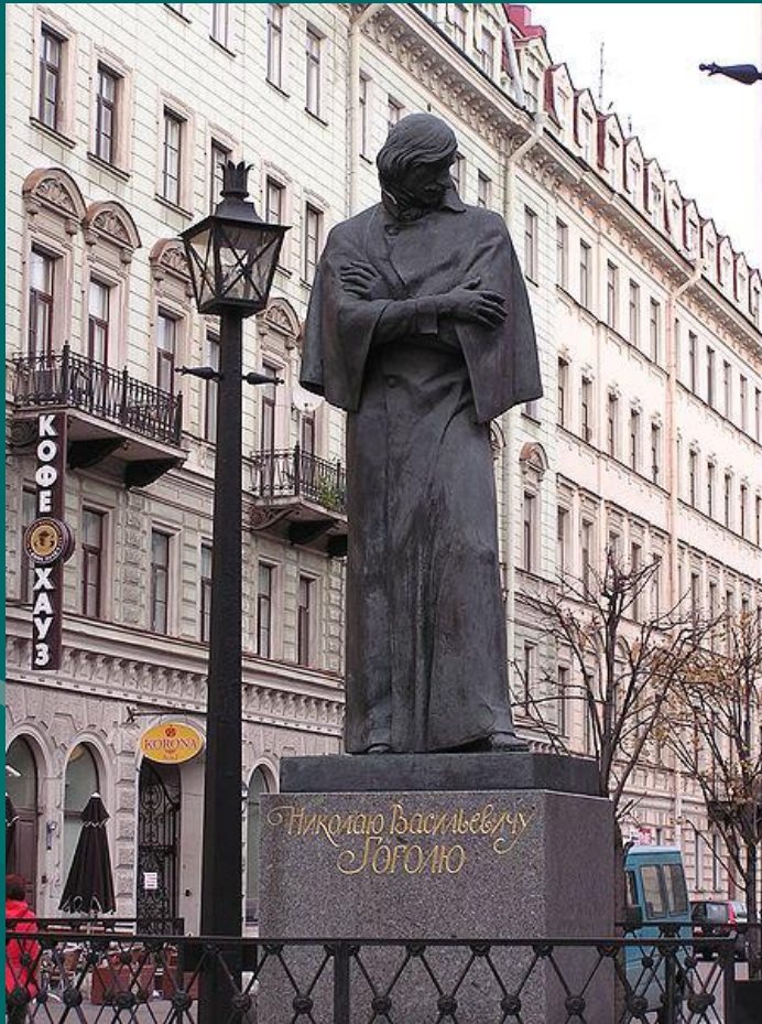
Памятник Н.В. Гоголю в Петербурге

Молчи! Молчи, мой черный Гоголь! Спины тебе не разогнуть! Смеялся ты и плакал много ль, Российский измеряя путь?