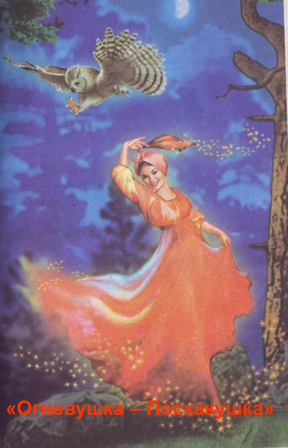
«Огневушка – Поскакушка»