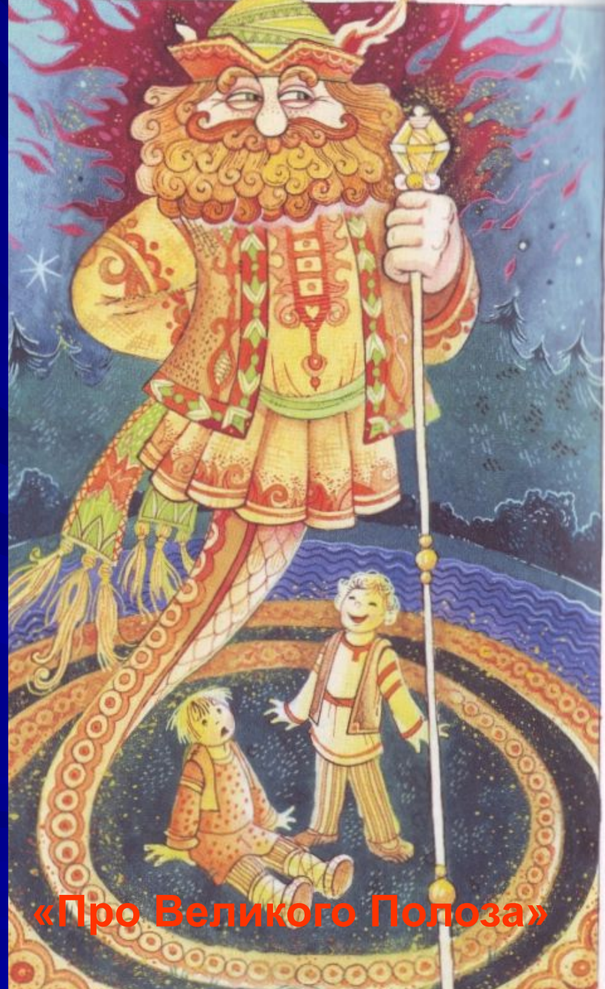
«Про Великого Полоза»