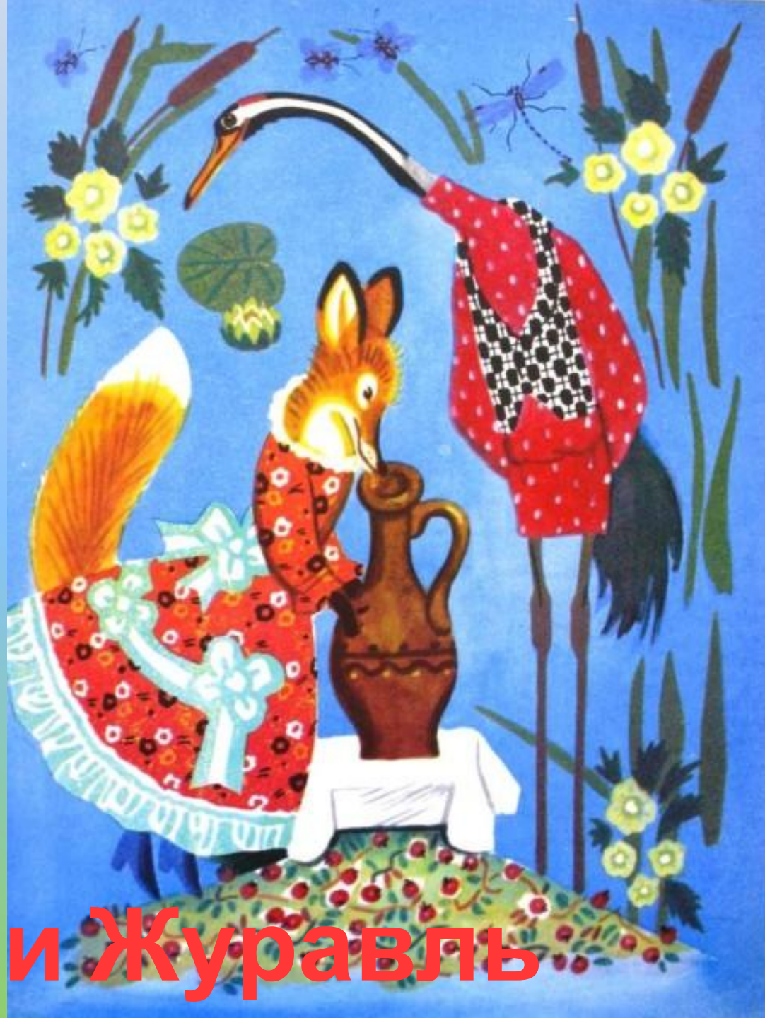
Лиса и Журавль