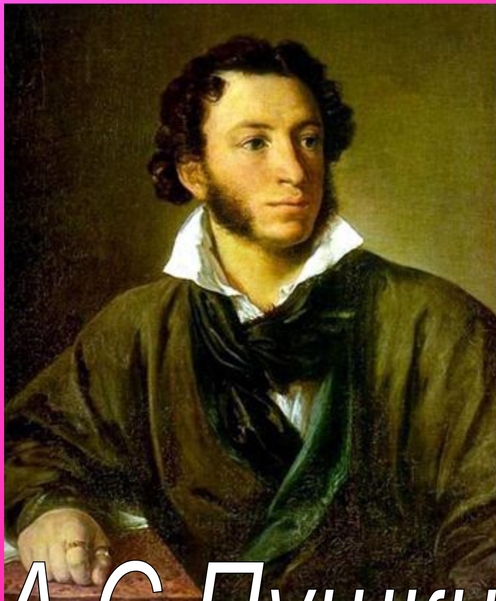
А. С. Пушкин