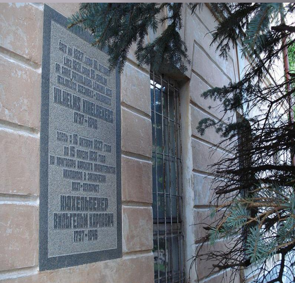
Мемориальная таблица в память Вильгельма Кюхельбекера в бывшей Динабургской крепости