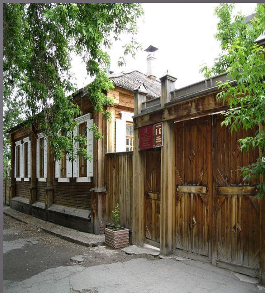
Дом-музей В. К. Кюхельбекера в Кургане