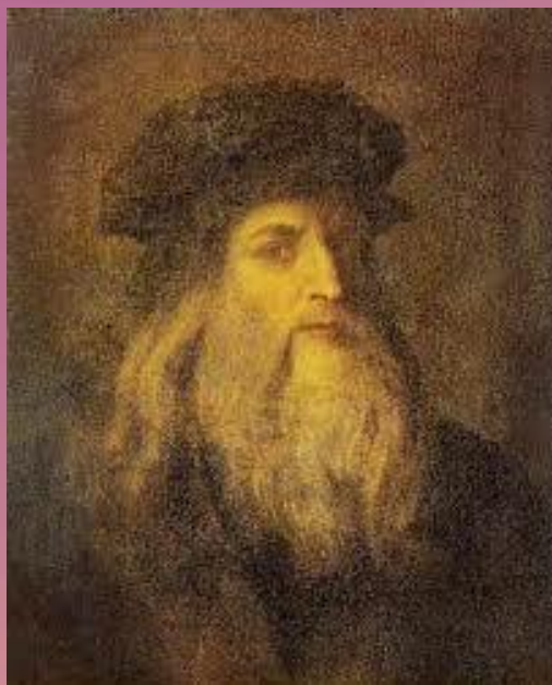
Леонардо да Винчи