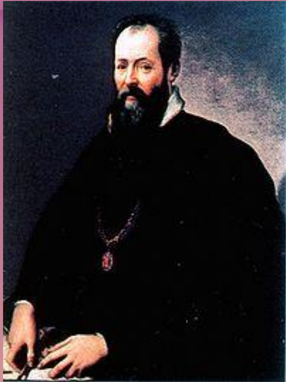
Джорджо Вазари (1511-1574)

Итальянский живописец, архитектор и писатель.